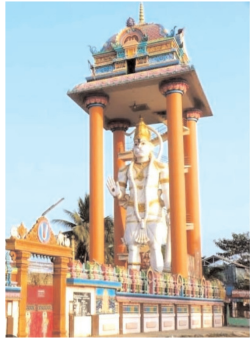
కార్యక్రమాలు నిర్వహించనున్నట్లు ఆలయ సందర్భంగా ఆలయంలో ఉన్న దత్తాత్రేయునికి తెలిపారు.