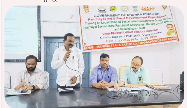
లింగసముద్రం పెన్ పవర్, డిసెంబర్ 13