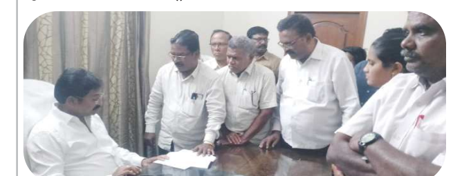
విజయవాడ, పెన్ పవర్, డిసెంబరు 13