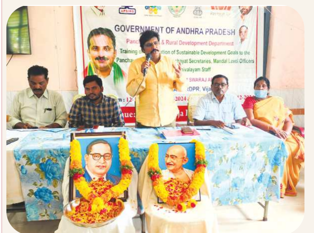
గుడ్లూరు, పెన్ పవర్, డిసెంబరు 13: