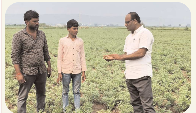
హైదరాబాద్, డిసెంబర్ 13

మండల వ్యవసాయ అధికారి రైతులకు రబీ సీజన్ యందు రైతులు సాగు చేసిన పంటలకు ప్రధానమంత్రి ఫసల్ బీమా యోజన పథకంలో చేరుటకు, మిముము, జొన్న, మొక్కజొన్న, శనగ, మిరప పంటలకు బీమా చెల్లింపుకు డిసెంబర్ 15, వరి పంటకు 31వ తారీకు తుది గడువు. రైతులు రబీ సీజన్ యందు సాగు చేసిన అన్ని పంటలను, రైతు సేవాకేంద్రం సిబ్బందిని సంప్రదించి, ఈ- పంట సమాను చేపించుకోవాలని తెలిపారు. ఈ పంటలో సమాను అయ్యి, నోటిఫై చేయబడిన పంటలకు మాత్రమే ఫసల్ బీమా యోజన పథకం వర్తిస్తుందని తెలిపారు. ప్రధానమంత్రి ఫసల్ బీమా యోజన ద్వారా శనగ రూ.368, మిముములు రూ.103, మొక్కజొన్న రూ.105, ఎండు మిరప రూ.525, జొన్న రూ.60 లు ఎకరానికి రైతులు డిసెంబర్ 15 వ తారీకు లోపల వరి రూ.215, డిసెంబర్ 31 లోపల మి సేవల ద్వారా గాని, సి.యస్.సి సెంటర్ల ద్వారా గాని బీమా చెల్లించాలని తెలిపారు.