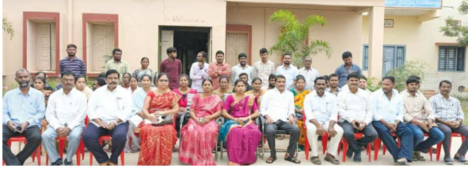
కొమరోలు పెన్ పవర్ డిసెంబర్ 12