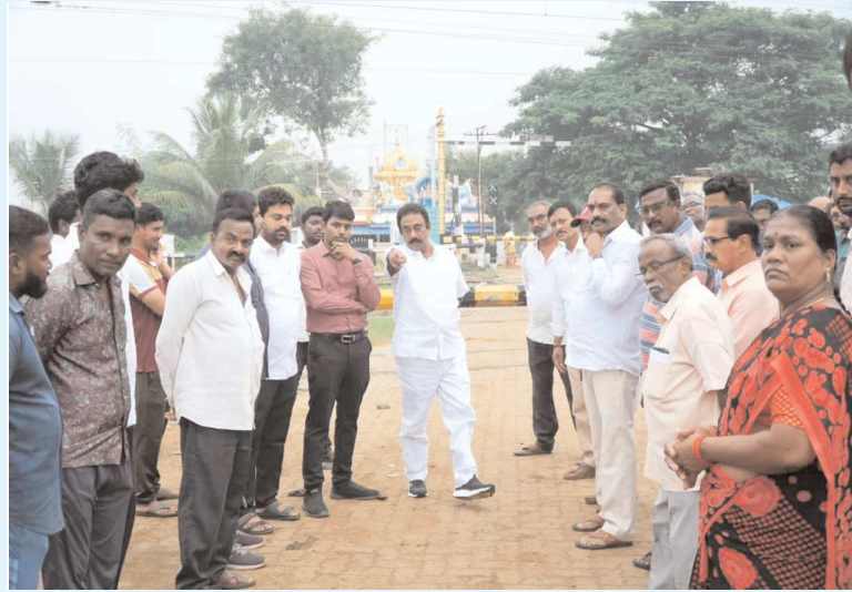
కావలి పెన్ పవర్ డిసెంబర్ 12