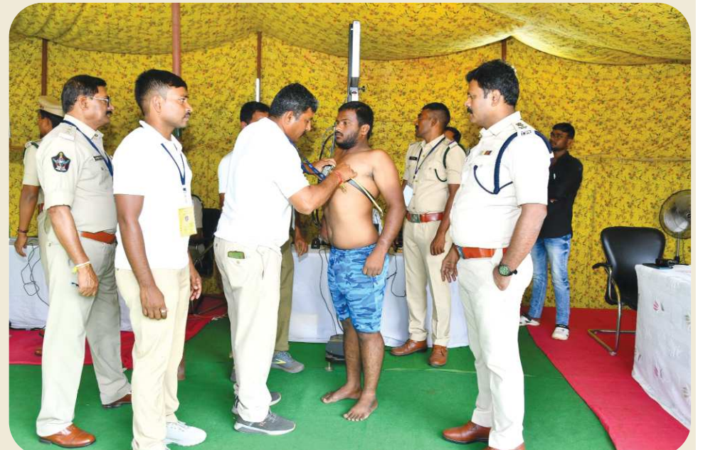
స్పోర్ట్ రిపోర్టర్ ఒంగోలు, పెన్ పవర్ డిసెంబర్ 30