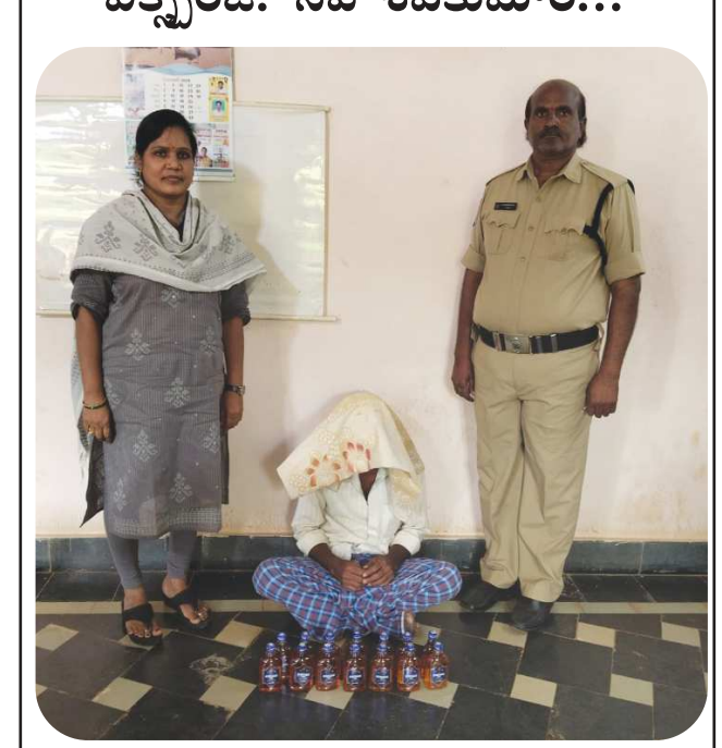
సింగరాయకొండ, పెన్ పవర్ డిసెంబర్ 30