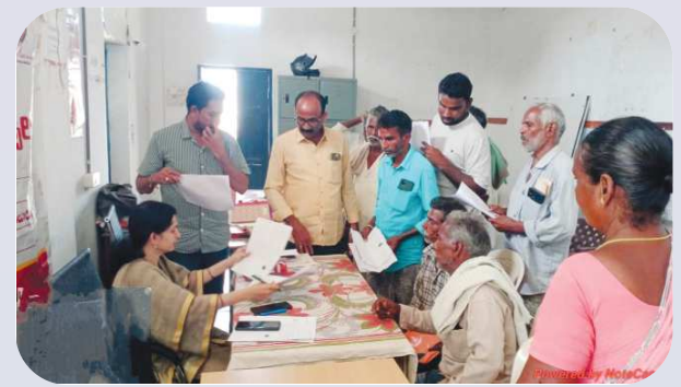
గుడ్లూరు, పెన్ పవర్, డిసెంబర్ 30:

గ్రామస్థాయిలోనే భూ సమస్యల శాశ్వత పరిష్కారానికై ప్రత్యేక దృష్టి సారించి, రాష్ట్ర ప్రభుత్వం ఎంతో ప్రతిష్టాత్మకంగా నిర్వహిస్తున్న రెవిన్యూ సదస్సులకు ఫిర్యాదుల పరంపర కొనసాగుతోంది. రెవిన్యూ సదస్సుల షెడ్యూలు ప్రకటించి డిసెంబరు 6 నుంచి జనవరి 8 వరకు సదస్సులు నిర్వహించ తలపెట్టిన విషయం తెలిసిందే. దీనిలో భాగంగా మండలంలోని చినలాటిరిఫి పంచాయతీలో జరిగిన రెవిన్యూ సదస్సును స్థానిక తహసీల్దార్ స్వర ఆధ్వర్యంలో సోమవారం నిర్వహించారు. ఈ రెవిన్యూ సదస్సుకు మొత్తం 17 అర్జీలు వచ్చాయని ఆమె తెలిపారు. కొన్ని అర్జీలకు అక్కడికక్కడే పరిష్కారం చూచగా, మిగిలిన వాటిని త్వరితగతిన పరిష్కరించునామని తహసీల్దార్ తెలిపారు. ఈ కార్యక్రమంలో పీ.ఆర్.ఓ బాలాజీ, రెవిన్యూ సిబ్బంది, సచివాలయ సిబ్బంది, స్థానిక నాయకులు తదితరులు పాల్గొన్నారు.