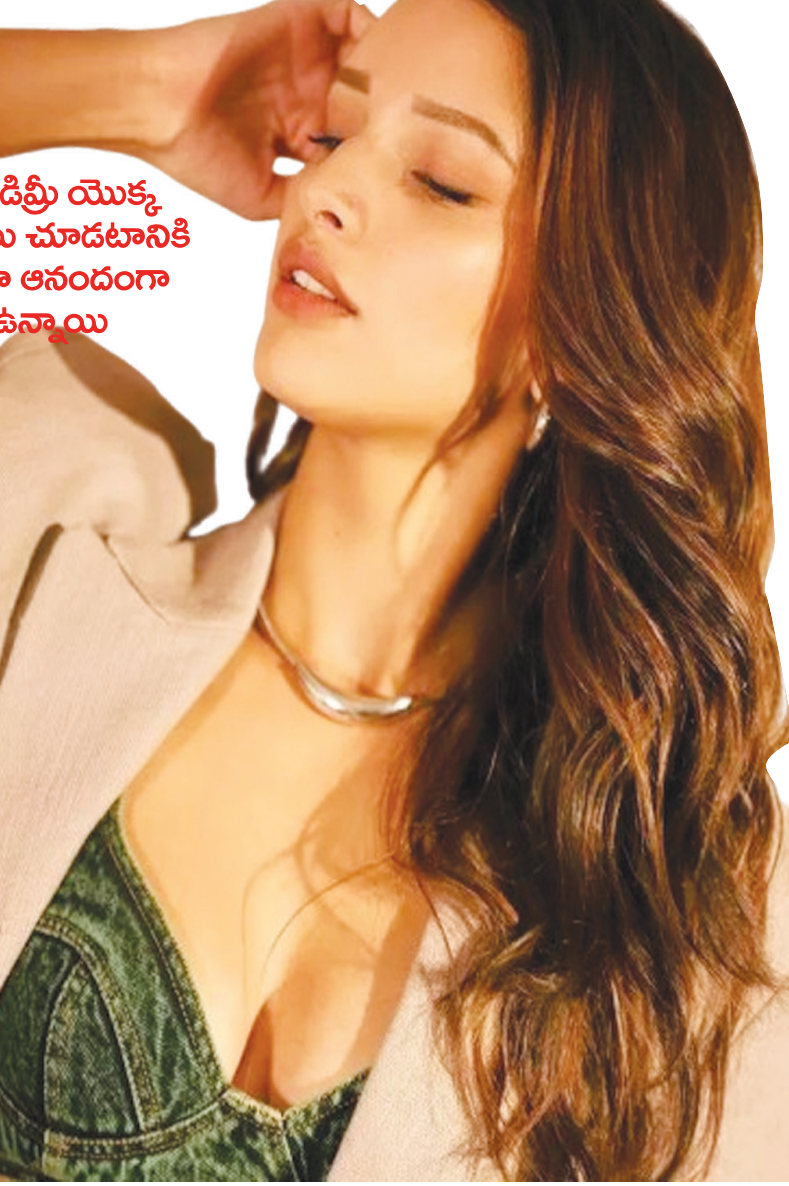
లిఫ్ట్ డిప్లీ యొక్క దుస్తులు చూడటానికి చాలా ఆనందంగా ఉన్నాయి

కోలీవుడ్ మూవీ అయిలాన్ కూడా నిరాశపరిచింది. అయితే ఆ రెండు సినీమాలూ కూడా ఎప్పుడో రిలీజ్ కావాల్సి ఉండగా.. అనేక కారణాల వల్ల వాయిదా పడ్డాయి. చివరకు 2024లో రిలీజ్ అయ్యాయి. కానీ రకుల్ కు నిరాశ ఎదురయ్యేలా చేశాయి. అయితే ప్రస్తుతం నార్త్ లో మూడు సినీమాల్లో నటిస్తున్నారు రకుల్ ప్రీత్ సింగ్. దే దే ప్యార్ దే 2, మేరీ హస్నంద్ కీ బీవీ, అమీర్ సినీమాల్లో రకుల్ నటిస్తుండగా.. ఆ చిత్రాల్లో ఆమె రోల్స్ చాలా కొత్తగా ఉండనున్నట్లు తెలుస్తోంది. ఆ మూడు సినీమాలూ కూడా 2025లోనే ప్రేక్షకుల ముందుకు రానున్నాయి. అదే సమయంలో సౌత్ లో ఆమె యాక్ట్ చేసిన భారతీయుడు-3.. విడుదలకు సిద్ధంగా ఉంది. ఓటీటీలో నేరుగా రిలీజ్ అవుతుందని వార్తలు వచ్చినా.. రీసెంట్ గా థియేటర్లలోనే భారతీయుడు-3 విడుదల అవుతుందని శంకర్ క్లారిటీ ఇచ్చారు. 2025లోనే రిలీజ్ కానుంది ఆ చిత్రం కూడా. అలా కొత్త ఏడాదిలో రకుల్ ప్రీత్ సింగ్ బొస్ బ్యాక్ ఇవ్వాలని చూస్తున్నారు. మంచి హిట్స్ అందుకోవాలని తహతహలాడుతున్నారు. మరి రకుల్ కొత్త చిత్రాలు ఎలా ఉంటాయో? ఆమె ఎలాంటి హిట్స్ అందుకుంటారో వేచి చూడాలి.