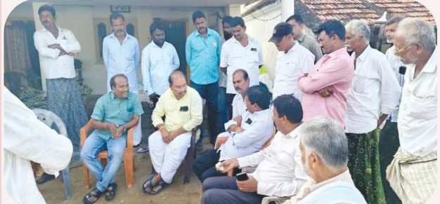
పాస్చులూరు పెన్ పవర్ డిసెంబర్ 29