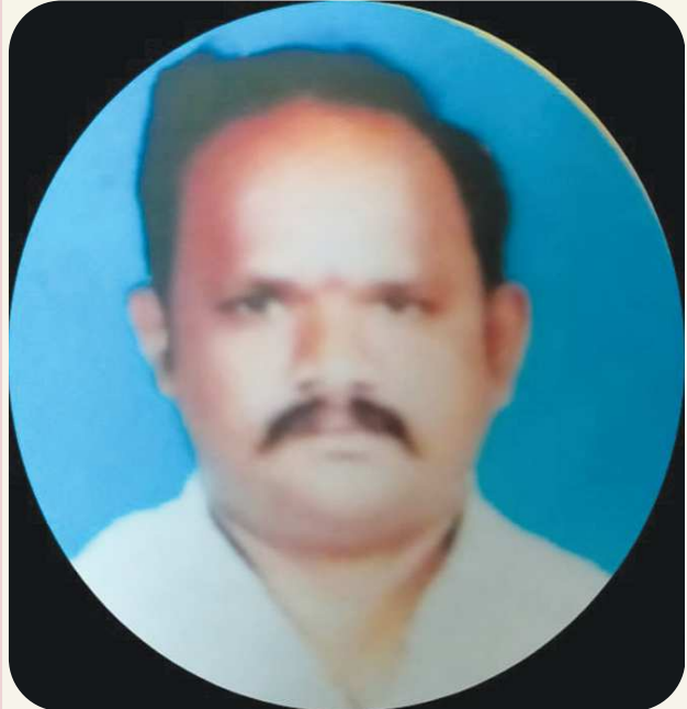
గిద్దలూరు, పెన్ పవర్, డిసెంబర్ 29