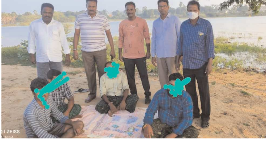
కావలి పెన్ పవర్ డిసెంబర్ 29 కావలి రూరల్ సర్కిల్ ఇన్స్పెక్టర్ జి రాజేశ్వరరావు కు అందిన సమాచారం మేరకు కావలి మండలం కొండయ్య గారిపాలెం గ్రామంలో

పోలీసులకు గుడి ప్రక్కన నలుగురు వ్యక్తులు పేకాట ఆడుతున్నారని కావలి సర్కిల్ ఇన్స్పెక్టర్ జి. రాజేశ్వరరావుకు సమాచారం అందగా వెంటనే కావలి రూరల్ ఎస్సై తిరుమలరెడ్డికి విషయాన్ని అందించగా వారి సిబ్బందితో కలిసి అక్కడ పేకాట ఆడుతున్న వారిని పట్టుకొని వారి వద్ద ఉన్న 1,280 ను స్వాధీనం చేసుకుని కేసు నమోదు చేశారు. అనంతరం సర్కిల్ ఇన్స్పెక్టర్ మాట్లాడుతూ, రూరల్ రూరల్ మండల పరిధిలో ఎక్కడైనా పేకాట, కోడిపందాలు ఆడుతున్న అట్లు మరియు గంజాయి అమ్ముతున్నట్లు సమాచారం ఉన్నచో వెంటనే పోలీసులకు సమాచారం అందించిన వారి విషయం గోప్యంగా ఉంచడం జరుగుతుందని సమాజంలో మాదకద్రవ్యాలను అరికట్టాలంటే ప్రజలు కూడా పోలీసులకు సహకరించాలని ఆయన కోరారు.