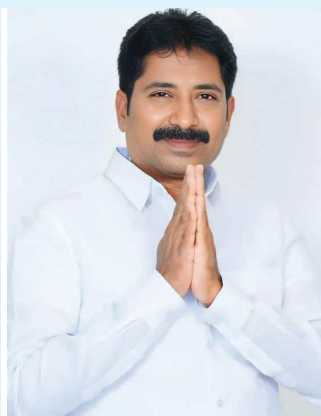
కొమరోలు పెన్ పవర్ డిసెంబర్ 29