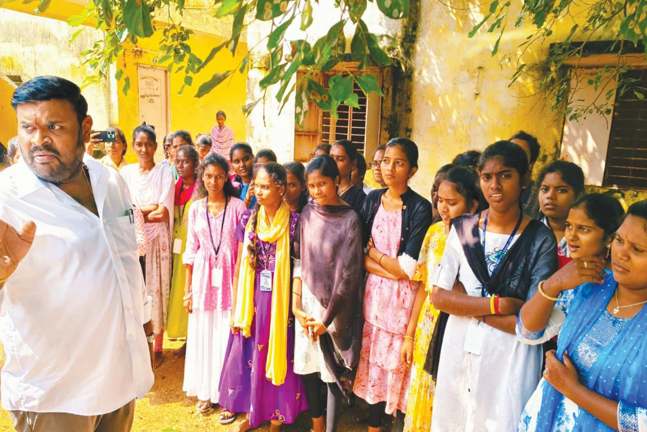
శ్రీకాళహస్తి - పెన్ పవర్, డిసెంబర్ 21