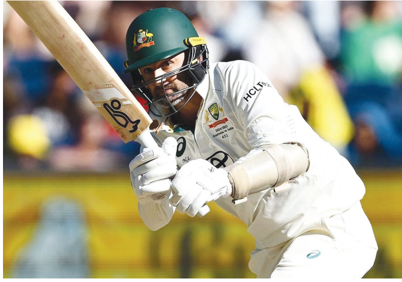
కావడంతో భారత జట్టు ఇన్నింగ్స్ ముగిసింది. ఆస్ట్రేలియా ప్రస్తుతం 333 పరుగుల ఆధిక్యం సాధించి బలమైన పొజిషన్ లోనే ఉంది. ఆటకు రేపు చివరి రోజు కావడంతో భారత్ పై ఒత్తిడి పెరిగి అవకాశం ఉంది. నేటిలాగే రేపు కూడా పిచ్ బౌలర్లకు అనుకూలినై భారత్ కు కష్టాలు తప్పనట్టే. ఆసీస్ బౌలింగ్ ను సమర్థంగా అడ్డుకోగలిగితే మ్యాచ్ డ్రాగా ముగుస్తుంది.

హైదరాబాద్ పెన్ పవర్: బోర్డర్-గవాస్కర్ ట్రోఫీలో భాగంగా మెల్బోర్న్ లో భారత్-ఆస్ట్రేలియా మధ్య జరుగుతున్న నాలుగో టెస్టు నాలుగో రోజు ఆట ముగిసింది. రెండో ఇన్నింగ్స్ లో ఆస్ట్రేలియా 9 వికెట్ల కోల్పోయి 228 పరుగులు సాధించింది. తొలి ఇన్నింగ్స్ అధికారాన్ని కలుపుకొంటే ఆసీస్ లీడ్ 333 పరుగులకు చేరింది. భారత జట్టు 369 పరుగుల వద్ద ఆటలో అయిన తర్వాత రెండో ఇన్నింగ్స్ ప్రారంభించిన ఆస్ట్రేలియాను భారత బౌలర్లు బుర్రా, సిరాజ్ కోలుకోలేని దెబ్బతీశారు. పదునైన బంతలతో బ్యాటర్లను పజికించారు. వీరి దెబ్బకు వడివడిగా వికెట్లు కోల్పోయిన ఆస్ట్రేలియా ఒకానొక దశలో 91 పరుగులకే ఆరు వికెట్లు కోల్పోయి పీకల్లోతు కస్టాల్లో కూరుకుపోయింది. అయితే, కెప్టెన్ పాల్ కమిన్స్, నాథన్ లియాన్ (41) వికెట్ల పతనానికి అడ్డుకట్ట వేశారు. ఇద్దరూ కలిసి నెమ్మదిగా పరుగులు సాధిస్తూ స్కోరు బోర్డుపై పరుగులు పేర్చుకుంటూ పోయారు. 41 పరుగులు చేసిన కమిన్స్ ను రవీంద్ర జడేజా బోల్టా కొట్టించాడు. ప్రస్తుతం నాథన్ లియాన్ 41, స్టాబ్ బోలాండ్ 10 పరుగులతో క్రీజులో ఉన్నారు. అంతకుముందు ఓవర్ నైట్ స్కోరు 358/9 వద్ద ఈ ఉదయం తొలి ఇన్నింగ్స్ కొనసాగించిన భారత జట్టు మరో 11 పరుగులు మాత్రమే జోడించి 369 పరుగుల వద్ద ఆటలో అయింది. నిన్న అద్భుత సంచరితో చెలరేగిన నితీశ్ కుమార్ రెడ్డి 114 పరుగుల వ్యక్తిగత స్కోరు వద్ద ఔట్