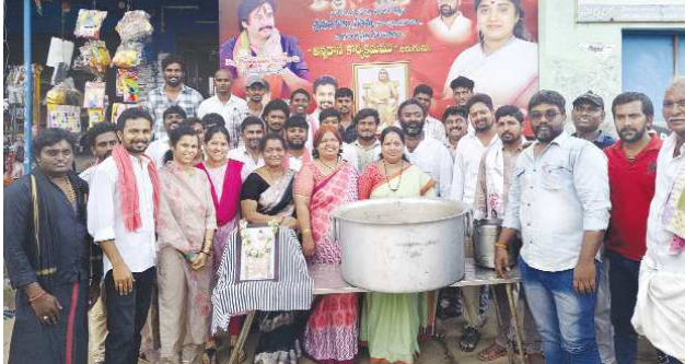
శ్రీ కాళహస్తి - పెన్ పవర్, డిసెంబర్ 26

శ్రీకాళహస్తి నియోజకవర్గ జనసేన పార్టీ ఇంధార్పి వినుత కోటా