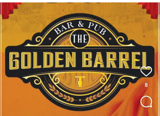
బాచుపల్లిలో ఓ అక్రమ షెడ్యూలో.. “గోల్డెన్ బ్యారెల్” పబ్..