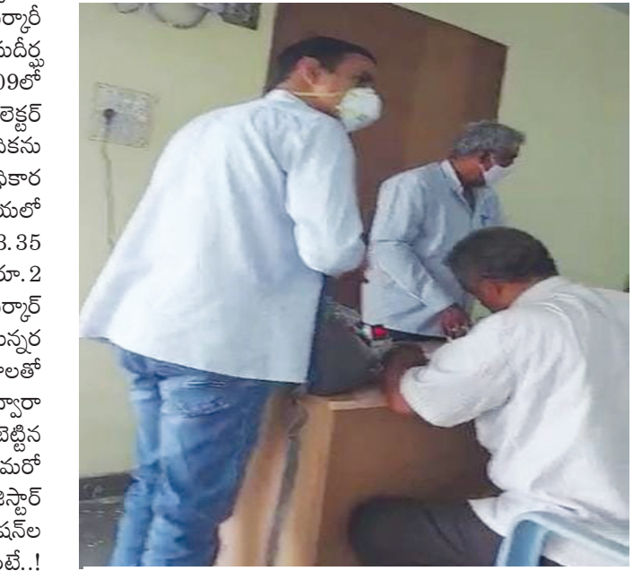
2021 జూన్ 30న.. వేలంపాటలో డబ్బుల లెక్కింపు.. నాటి ఫైల్ ఫోటో..