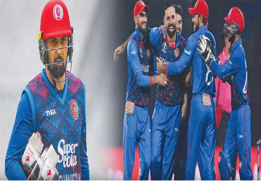
షకీబ్ హసన్ ను వెనక్కి నెట్టి నబీ టాప్ ఫైనకు చేరుకున్నాడు. అప్పటికి ఈ ఆఫ్ఘన్ ఆల్ రౌండర్ వయసు 39 ఏళ్ల 43 రోజులు.

హైదరాబాద్ పెన్ పవర్: ఆఫ్ఘనిస్థాన్ వెటరన్ ఆల్ రౌండర్ మహ్మద్ నబీ సంచలన నిర్ణయం తీసుకున్నాడు. వన్ డేల నుంచి తప్పుకోవాలని నిర్ణయించుకున్నాడు. వచ్చే ఏడాది పాకిస్తాన్ వేదికగా జరగనున్న బీసీసీఐ ఛాంపియన్స్ ట్రోఫీ 2025 తర్వాత అతను 50 ఓవర్ల ఫార్మాట్ నుంచి వైదొలగనున్నాడు. ఈ విషయాన్ని ఆఫ్ఘన్ క్రికెట్ బోర్డు చీఫ్ ఎగ్జిక్యూటివ్ సీనియర్ ఖాన్ ద్రువీకరించారు. "నబీ తప్పుకోవడానికే వచ్చున్న వార్తలు నిజమే. వచ్చే ఏడాది ఛాంపియన్స్ ట్రోఫీ ముగిశాక అతను వన్ డేల నుంచి వైదొలగనున్నాడు. కొన్ని నెలల ముందే ఈ విషయాన్ని మా దృష్టికి తీసుకొచ్చాడు. మేం తన నిర్ణయాన్ని స్వాగతించాం. జట్టులోకి వస్తున్న యువ క్రీకెటర్లు పట్ల అతను సంతోషం వ్యక్తం చేశాడు. యువ క్రీకెటర్ల చేతిలో ఆఫ్ఘనిస్థాన్ క్రికెట్ భవిష్యత్ బాగుంటుందని నమ్మాడు. అతను వన్ డేలకు ముంగింపు పలికినా, టీ20 ఫార్మాట్ లో కొనసాగుతాడని ఆశిస్తున్నాం." అని ఏసీబీ చీఫ్ ఒక ప్రకటనలో తెలిపారు.