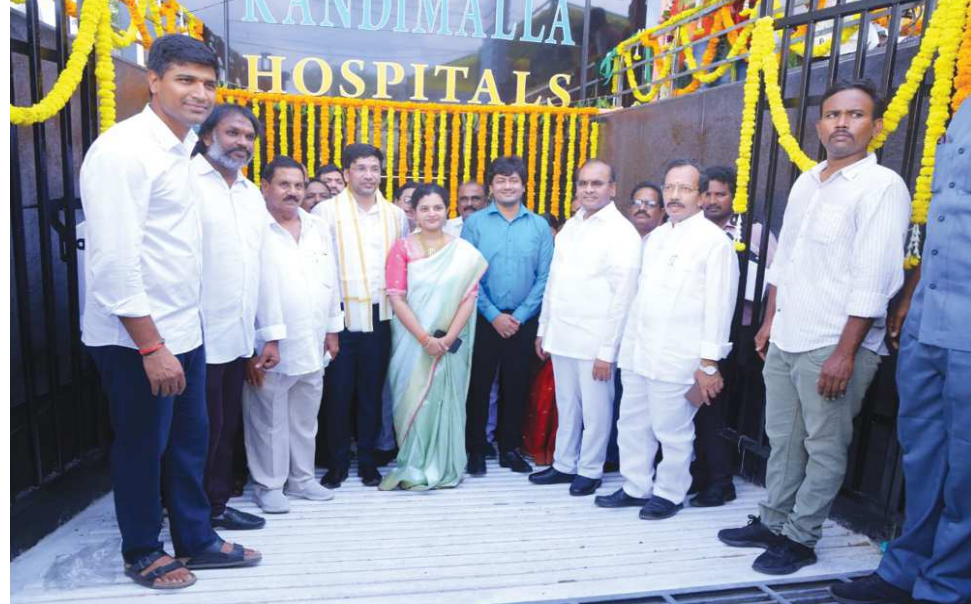
చిలకలూరిపేట పెన్ పవర్ ప్రతినీధి నవంబర్ 08: గతంలో మెరుగైన వైద్యం కోసం గుంటూరు, విజయవాడ, హైదరాబాద్ వైపు ప్రజలు చూసే పరిస్థితి ఇటీవల కాలంలో తగ్గిపోయిందని,