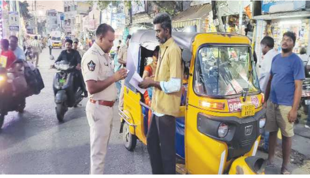
ఓంగోలు పెన్ పవర్ నవంబర్ 8

జిల్లాలో నేరాలు శాంతిభద్రతలను నియంత్రించేందుకు జిల్లా వ్యాప్తంగా పోలీసులు తనిఖీలు నిర్వహిస్తున్నారు. డ్రంక్ అండ్ డ్రైవ్ త్రిబుల్ రైడింగ్ హై స్పీడ్ హెల్మెట్ ధరించటం ట్రాఫిక్ రూల్స్ పాటించటం మత్తు పదార్థాల అక్రమ రవాణా, లాంటి అసాంఘిక కార్యకలాపాలు అరికట్టేందుకు నిత్యం తనిఖీలు చేపడుతున్నారు. ప్రజలు సహకరించాలని శాంతిభద్రతలు నేరాలు నియంత్రణ ప్రజల రక్షణ కొరకు తనిఖీలు చేపట్టడం జరుగుతుందని వారు తెలిపారు. శాంతి భద్రతల పరిరక్షణ, నేర నియంత్రణను లక్ష్యంగా విజిబుల్ పోలీసింగ్ చెయ్యటం లక్ష్యంగా జిల్లా ఎస్పీ ఎ.ఆర్. దామోదర్ ఆదేశాల మేరకు జిల్లా పోలీసులు ఆయా పోలీస్ స్టేషన్ల పరిధిలో ప్రధాన రోడ్డు మార్గాలు, రద్దీ ప్రాంతాలు, ముఖ్య కూడళ్ళు, ప్రజలు ఎక్కువగా సంచరించే,