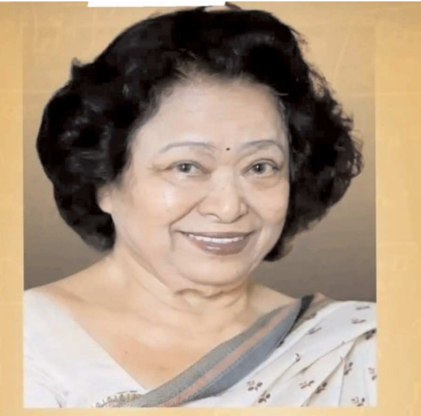
మానవ గణన యంత్రముగా పేరుగాంచిన ప్రపంచ ప్రసిద్ధ గణిత, ఖగోళ, జ్యోతిష శాస్త్రవేత్త శకుంతలా దేవి జయంతి: నవంబర్ 04