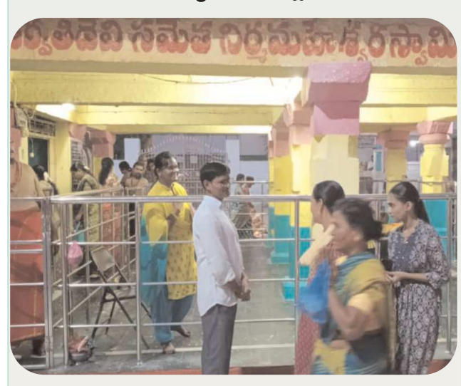
పొదిలి, పెన్ పవర్ సపంచం 4