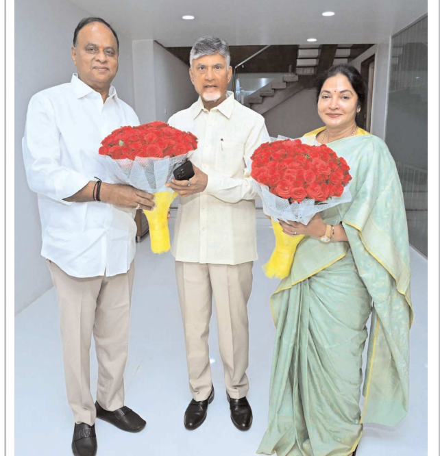
బ్యారో పెన్ పవర్, నెల్లూరు నవంబర్ 4: