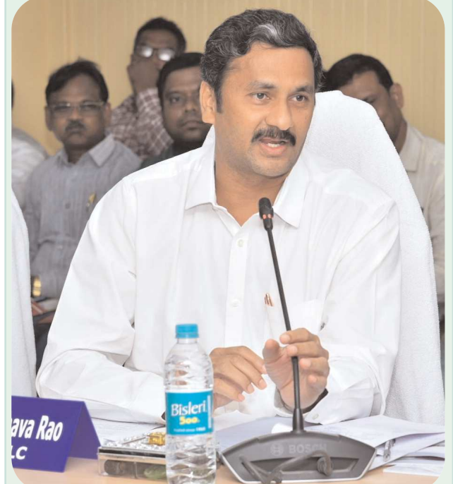
కందుకూరు పెన్ పవర్, నవంబర్ 4

కందుకూరును ప్రకాశం జిల్లాలో కలపాలి ఎమ్మెల్యే తూమాటి మాధవరావు