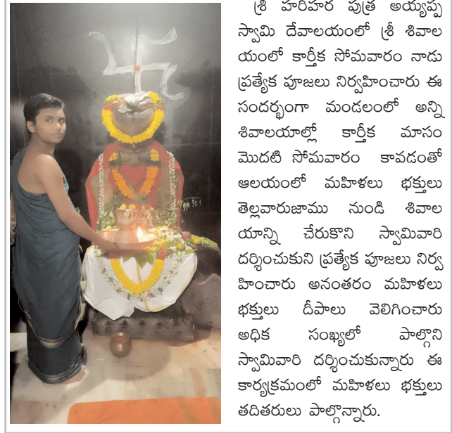
పెద్ద డోర్నాల పెన్ పవర్ నవంబర్ 4

శ్రీ హరిహర పుత్ర అయ్యప్ప స్వామి దేవాలయంలో శ్రీ శివాలయంలో కార్తీక సోమవారం నాడు ప్రత్యేక పూజలు నిర్వహించారు ఈ సందర్భంగా మండలంలో అన్ని శివాలయాలలో కార్తీక మాసం మొదటి సోమవారం కావడంతో ఆలయంలో మహిళలు భక్తులు తెల్లవారుజాము నుండి శివాలయాన్ని చేరుకొని స్వామివారి దర్శించుకుని ప్రత్యేక పూజలు నిర్వహించారు అనంతరం మహిళలు భక్తులు దీపాలు వెలిగించారు అధిక సంఖ్యలో పాల్గొని స్వామివారి దర్శించుకున్నారు ఈ కార్యక్రమంలో మహిళలు భక్తులు తదితరులు పాల్గొన్నారు.