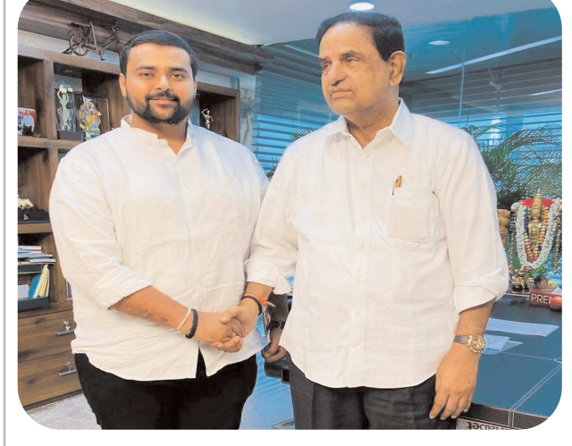
పలమనేరు సవంబర 04, (పెన్ పవర్)