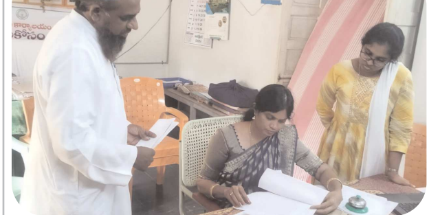
కోమరోలు పెన్ పవర్ సవంబర 4