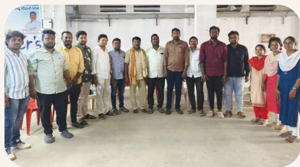
పొదిలి, పెన్ పవర్ సవంబర 4