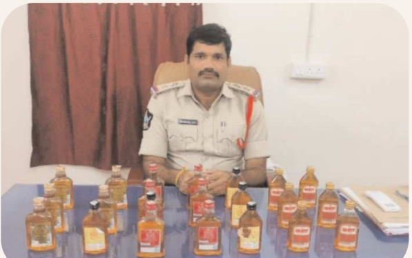
బేస్తవారిపేట, పెన్ పవర్ సవంబర 4