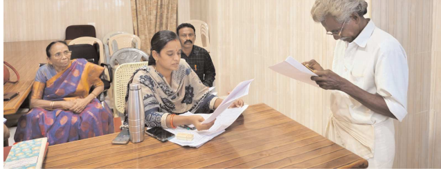
కందుకూరు పెన్ పవర్, నవంబర్ 4:

కందుకూరు పురపాలక సంఘం కార్యాలయమునందు నిర్వహించిన