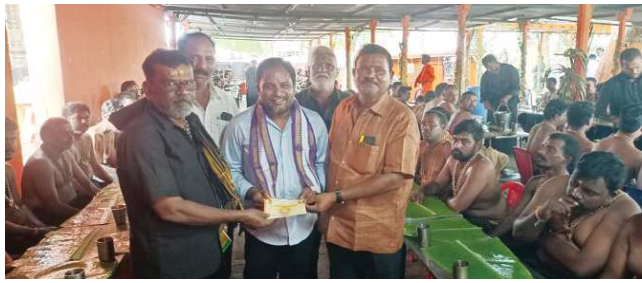
కందుకూరు పెన్ పవర్, నవంబర్ 4

కందుకూరు పట్టణంలో కనిగిరి రోడ్డు నందు ఉన్న శ్రీ అయ్యప్ప స్వామి ఆలయం ఆవరణ వెనుక భాగంలో శ్రీ అయ్యప్ప స్వామి సేవా సంఘం ఆధ్వర్యంలో నూతనంగా నిర్మిస్తున్న శ్రీ అయ్యప్ప స్వామి అన్న ప్రసాద