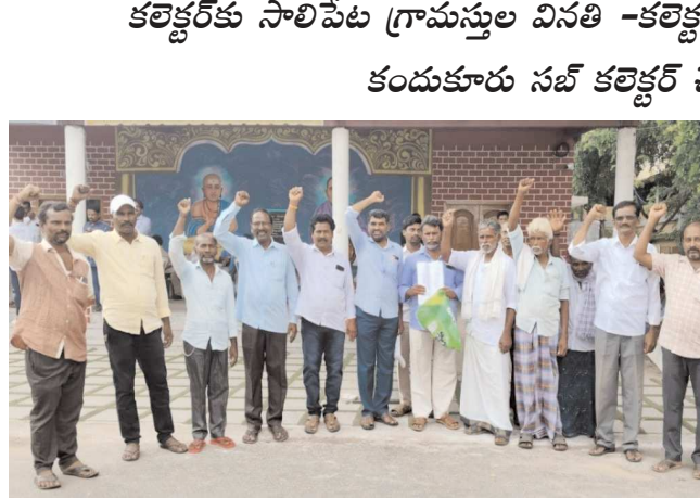
గుడ్లూరు, పెన్ పవర్, సపంచం 04: