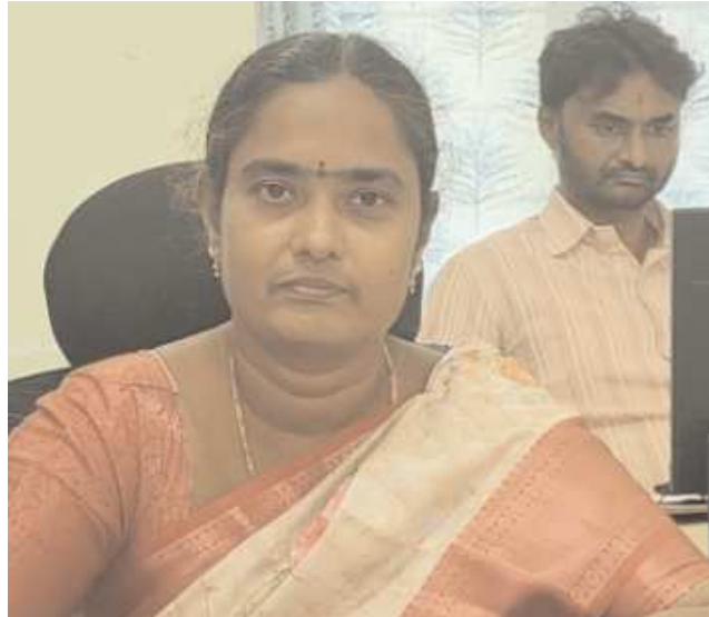
బ్యారో పెన్ పవర్, ప్రకాశం నవంబర్ 4

ఆంధ్ర కేసరి యూనివర్సిటీ పరిధిలోని 88 డిగ్రీ కళాశాలలో