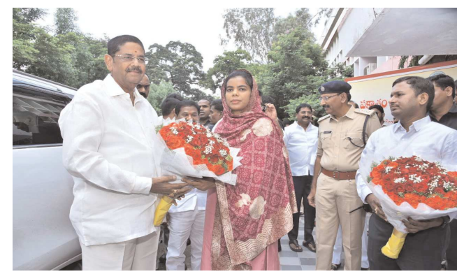
ఓంగోలు పెన్ పవర్ సచివాలయం 4