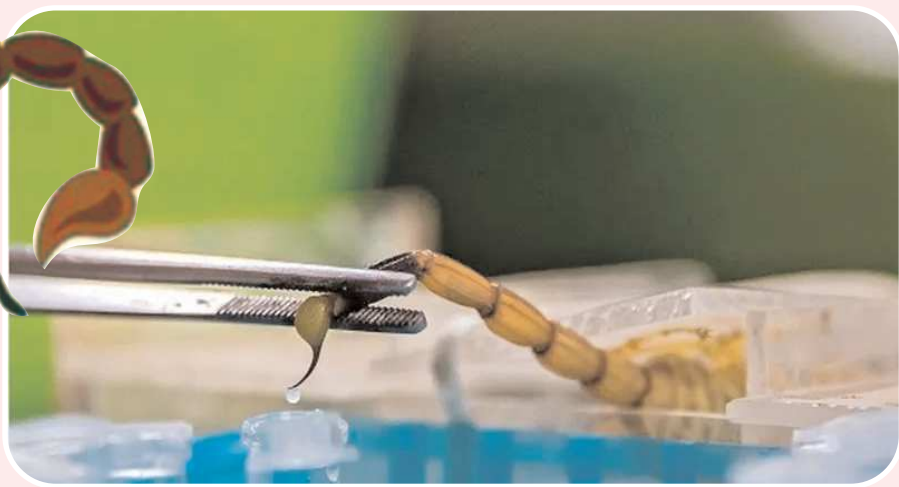
తేళ్ల నుండి విషం తీయాలి. అయితే ఒక లీటరు విషం సుమారు పది లక్షల తేళ్ల నుండి విషాన్ని సేకరించాలి. లీటరు ధర రూ.80 నుండి 84 కోట్ల ధర పలుకుతోంది.