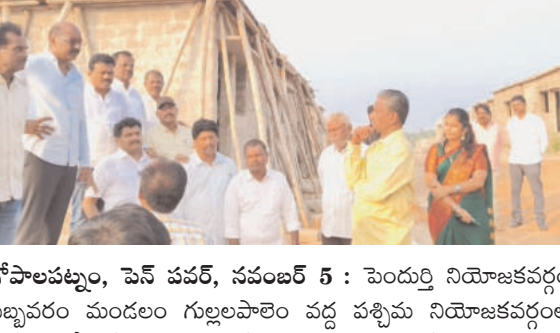
గోపాలపట్నం, పెన్ పవర్, నవంబర్ 5 : పేందర్ని నియోజకవర్గం, సబ్బరం మండలం గుల్లలపాలెం వద్ద పశ్చిమ నియోజకవర్గంలో జీ.వీ.ఎం.సీ జోన్ -8 పరిధిలో గల లబ్ధిదారులకు కేటాయించిన వన్ సెంట్ పట్టణ ఇల్లులను విశాఖ పశ్చిమ ఎమ్మెల్యే పెతకం శెట్టి