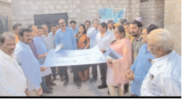
సందర్శించిన పశ్చిమ ఎమ్మెల్యే గణబాబు