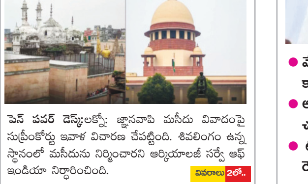
పెన్ పవర్ డెస్క్: జ్ఞానవాసి మసీదు వివాదంపై సుప్రీంకోర్టు ఇవాళ విచారణ చేపట్టింది. శివలింగం ఉన్న స్థానంలో మసీదును నిర్మించారని ఆర్కియాలజీ సర్వే ఆఫ్ ఇండియా నిర్ధారించింది.