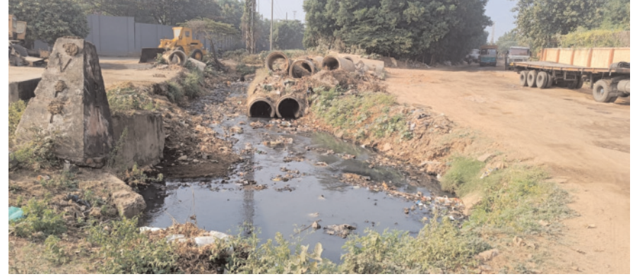
చుట్టం చూపుగా వచ్చి వెళ్లిన విశాఖ పోర్టు, జీ.వీ.ఎం.సీ అధికారులు మూతి జంక్షన్ నుంచి ములగాడ, ఎదురుగా నిపాలెం గ్రామాల రహదారి ప్రధాన రహదారిగా

వాహనదారులు గ్రామాల ప్రజలు, భయంతో ప్రయాణం. ములగాడ, పెన్ పవర్, నవంబర్ 22 : జీ.వీ.ఎం.సీ పరిధి పశ్చిమ నియోజకవర్గం 58 వ వార్డు పారిశ్రామిక ప్రాంతం సింధియా