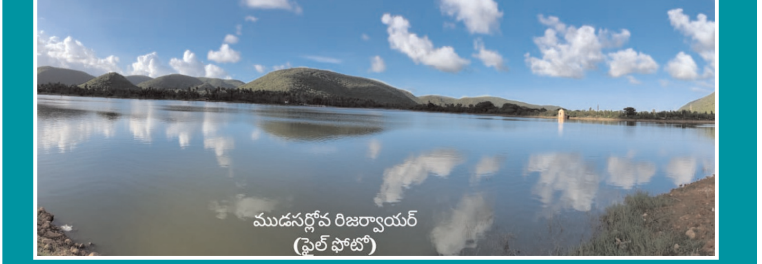
ముదనగోపాల్ రిజర్వాయర్ (ఫ్లోర్ ఫోటో)