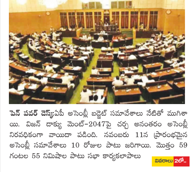
పెన్ పవర్ డెస్క్ ఏపీ అసెంబ్లీ బడ్జెట్ సమావేశాలు నేటితో ముగిశాయి. విజన్ డాక్యుమెంట్-2047పై చర్చ అనంతరం అసెంబ్లీ నిరవధికంగా వాయిదా పడింది. నవంబరు 11న ప్రారంభమైన అసెంబ్లీ సమావేశాలు 10 రోజుల పాటు జరిగాయి. మొత్తం 59 గంటల 55 నిమిషాల పాటు సభా కార్యకలాపాలు