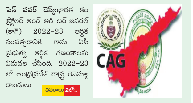
పెన్ పవర్ డెస్క్: భారత కంప్ట్రోలర్ అండ్ ఆడిటర్ జనరల్ (కార్గ్) 2022-23 ఆర్థిక సంవత్సరానికి గాను ఏపీ ప్రభుత్వ ఆర్థిక గణాంకాలను విడుదల చేసింది. 2022-23 లో ఆంధ్రప్రదేశ్ రాష్ట్ర రెవెన్యూ రాబడులు