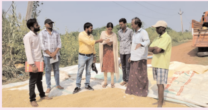
కాట్రేనికోవ్, పెన్ పవర్ నవంబర్ 22: