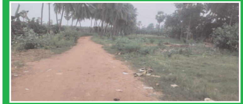
వియర్ కాలువ కు వంతెన మోక్షం కలిగేనా..

అగ్రేయపురం పెన్ పవర్ నవంబర్ 10: భారతీ స్థలం కన్సర్వేషన్ చాల్కట్టా చేయడం తరువాత దాన్ని ఇప్పటికే అమలుచేసిన కొందరి ప్రవృత్తి. వీరికి స్థానిక నాయకుల అండ ఉండనేది జగమెరిగిన సత్యం. అందుకే మన గ్రామంలో విలక్షణ చర్యలు, పుంత రోడ్లు, రహదారుల అంచులు, చివరికి స్వతః వాటికలా కనుచున్న పోతున్నాయనేది సగ్గు సత్యం. ర్యాలీ గ్రామశివారు చిన్నం వారి పాలెం సుమారు 100 కుటుంబాలు నివసిస్తున్నాయి. వీరు నిత్యావసరాలు, విద్య, వైద్యం, ఏదేని పంచాయతీ అవసరాలకు ర్యాలీ గ్రామానికి రావాలంటే మట్టి రోడ్డు తప్ప వేరే దారి లేదు. పన్నెండు కాలమైతే సరకం చూడాలిందే. ఈ పుంత దారిలో సుమారు 500 ఎకరాల్లో పండించే మెట్టపంటలు కండ్ల, బెండ, దొండ, పెండలం, అరటి మొదలగు పంటలు నిత్యం మార్కెట్ కు తరలించాలి. దీని తో రైతులు చాలా అగణ్య భరించక తప్పని పరిస్థితి. గతంలో పుంత రోడ్డు కొంత మేరకు అభివృద్ధి జరిగినా ఈ పుంత రోడ్డు మాత్రం ఎటువంటి అభివృద్ధి కి నోచుకోలేదు. భారతదేశానికి స్వాతంత్ర్యం వచ్చిన తర్వాత గోదావరి నదిపై పడవ ప్రయాణం చేయాలంటే ప్రమాదకరంగా మారిందని. గోదావరి వరద ఉప్పుత ఎక్కువగా ఉన్న సమయంలో పడవ ప్రయాణం లో రవాణా వ్యవస్థ సరికొండే పడడంతో అప్పటి ప్రభుత్వం గోదావరి నదులపై బ్రిడ్జి నిర్మించడానికి సుముఖం చూపింది. ప్రభుత్వ భూములే కేటాయించాలని ఈ బ్రిడ్జిలు పల్ల ప్రజలకు అప్పే సప్తం జరగకుండా