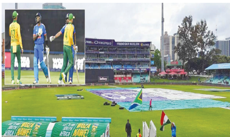
సౌతాఫ్రికా : మార్క్రమ్ (కెప్టెన్), రికెల్స్, స్టఫ్, క్లాసెన్, మిల్లర్, క్రుగర్, యాన్సెన్, సిమిలెన్, కోయెట్, కేవే మహారాజ్, పీటర్ / బార్డ్ మన్

హైదరాబాద్ పెన్ పవర్: తొలి టీ20 విజయంతో జోరుమీదున్న యంగ్ టీమిండియా.. సౌతాఫ్రికాతో రెండో మ్యాచ్ కు రెడీ అయ్యింది. ఆదివారం జరిగే ఈ మ్యాచ్ లోనూ గెలిచి నాలుగు మ్యాచ్ ల సిరీస్ లో స్పష్టమైన ఆధిక్యంలో నిలవాలని భావిస్తోంది. టీ20 వరల్డ్ కప్ ఫైనల్ లో అనుకుంటే సిరీస్ తొలి మ్యాచ్ లోనూ ఓడటం సౌతాఫ్రికా అత్యవశ్యాసాన్ని గట్టిగా దెబ్బతీసింది. దీంతో రెండో మ్యాచ్ లో గెలిచి లెక్క సరిచేయాలని చూస్తోంది. ఈ మ్యాచ్ హెయిరాహారిగా జరగడం ఖాయమన్న దశలో వర్షం రూపంలో మ్యాచ్ కు అంతరాయం ఏర్పడే అవకాశాలు కనిపిస్తున్నాయి. అక్టోబర్ ప్రకారం.. టాస్ సమయంలో వర్షం 49 శాతం నుండి 54 శాతం మధ్య కురుస్తుంది. రాత్రి 8 గంటలకు 63 శాతం.. రెండో ఇన్నింగ్స్ లో 40 శాతం వర్షం కురిసే అవకాశాలు ఉన్నాయి. మ్యాచ్ మొత్తం రద్దయ్యే అవకాశాలు కనిపించడం లేదు. ఒకవేళ వర్షం అంతరాయం కలిగిస్తే 5 ఓవర్ల మ్యాచ్ జరగనుంది. వాతావరణం చల్లగా ఉండడంతో షిప్ ఫాస్ట్ బౌలర్లకు అనుకూలమైంది. రాత్రి 7.30 గంటలకు స్ట్రాక్స్ % - 18, జియో సినిమాలో ప్రత్యక్ష ప్రసారం చేయబడుతుంది. ప్రస్తుతం సిరీస్ లో భారత్ 1-0 ఆధిక్యంలో ఉంది.