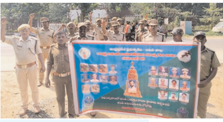
ఘన నివాళులు అర్పించిన పార్టీ అధికారులు