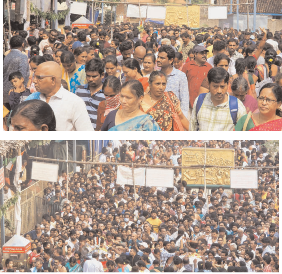
కార్మిక మానం రెండవ శనివారం 14 గా అయిన ఆలయం లో తగ్గని భక్తుల రద్దీ

ఆత్మేచ్ఛరు పెన్ పవర్ నవంబర్ 9: కోనసీమ తిరుమల వాడపల్లి క్షేత్రంలో అలివేలుమంగా వద్దావతి సమేత చందన స్వరూపుడు వెంకటేశ్వర స్వామి కొలువైయున్న స్వయంభు క్షేత్రానికి తెలుగు రాష్ట్రాల నుండి వేలాది గా భక్తులు తరలివచ్చి స్వామి వారి దర్శించుకుంటున్నారు. కార్మిక మానం రెండవ శనివారం కావడంతో వేకువజామునుండి భక్తులు ఆలయానికి పోవెత్తారు. ఆలయ సన్నిధిలో స్వామి వారి మేలుకొని సేవ బశ్యర్లు లక్ష్మి హేమం అంకరణోత్సవం సుప్రభాత సేవ అర్చకులు గమనించుమైన శోకంతో ఎంతో చక్కగా నిర్వహించారు. ఏడువారాల నోము నోచుకునే భక్తులు తెల్లవారుజామునే గోతమి గోదావరి నదిలో తల స్నానం ఆరంభించి స్వామివారికి తలసీలాలూ నమర్చించి సాంప్రదమైన దుస్తులతో స్వామి వారి దర్శనానికి ఆలయ మాడవీధుల్లో ఏడు ప్రదక్షిణలు నిర్వహిస్తూ గోవిందా, గోవిందా, గోవిందా, గోవింద నామస్మారణతో ఆలయమంతా మారుమోగాయి. అనంతరం స్వామివారి దర్శనానికి క్యూలైన్లో వేచి ఉండి స్వామివారిని దర్శించుకుని తీర్థప్రసాదాలు స్వీకరించారు. అనంతరం ఆలయ సన్నిధిలో ఏర్పాటు చేసిన అన్నదాన ప్రసాదాలు స్వీకరించారు. ఆలయానికి కార్మిక మానం