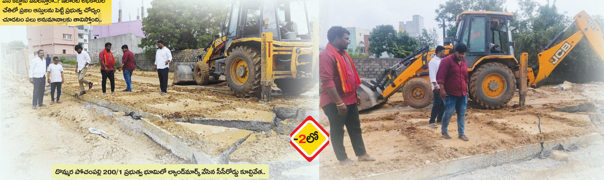
దొమ్మర పోచంపల్లి 200/1 ప్రభుత్వ భూమిలో ల్యాండ్ మార్క్ వేసిన సీసీరోడ్డు కూల్చివేత..