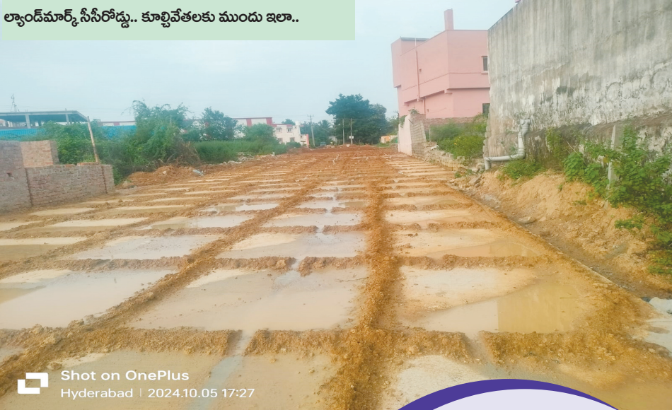
Shot on OnePlus Hyderabad | 2024.10.05 17:27