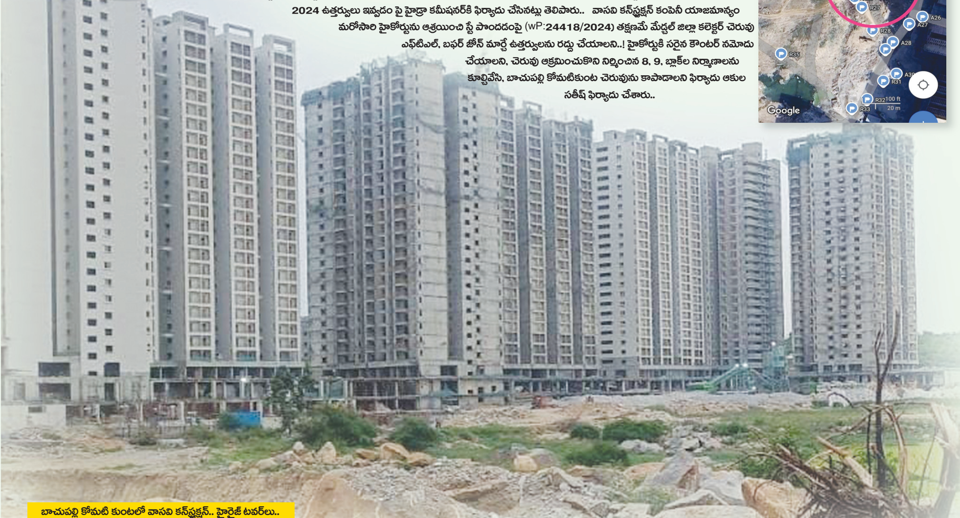
బాచుపల్లి కోమటి కుంటలో వాసవి కన్స్ట్రక్షన్.. హైరైజ్ టవర్లు..