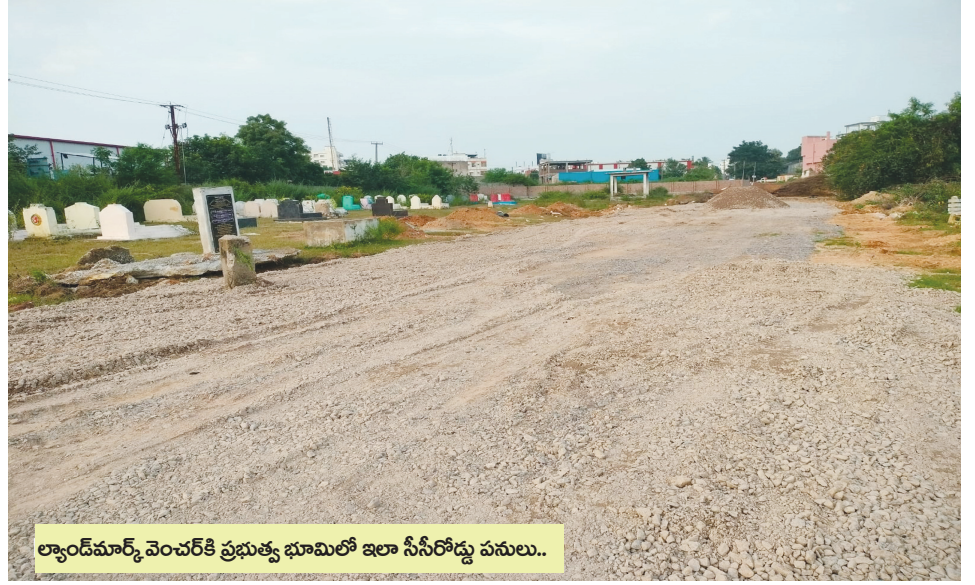
ల్యాండ్‌మార్క్ వెంచర్ కి ప్రభుత్వ భూమిలో ఇలా సీసీరోడ్డు పనులు..