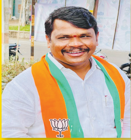
బీజేపీ నేత ఆకుల సతీష్ ముదిరాజ్..