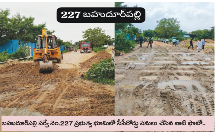
బహుదూర్ పల్లి సర్వే నెం.227 ప్రభుత్వ భూమిలో సీసీరోడ్డు పనులు చేసిన నాటి ఫోటో..