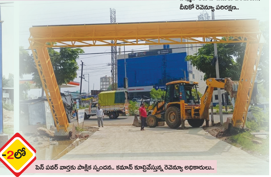
పెన్ పవర్ వార్డుకు పాక్షిక స్పందన.. కమాన్ కూల్చివేస్తున్న రెవెన్యూ అధికారులు..