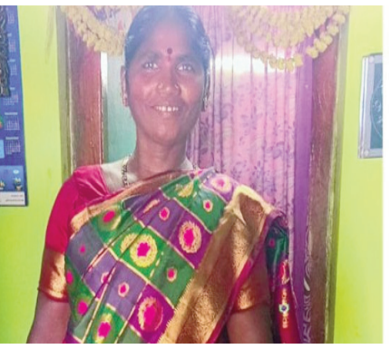
జరిగింది. బాధితురాలు ప్రస్తుతం ఆసుపత్రిలో చికిత్స పొందుతుంది.

మహిళా పరిస్థితి విషమంగా వుంది. పోలీసులు ఆమెను ఆసుపత్రికి తరలించారు. చికిత్స పొందుతూ మహిళ మృతి చెందింది. బుధవారం నిజాంపేట మండలం ప్రగతి ధర్మారం గ్రామంలో మంత్రాల నెపంతో మహిళపై దాడి