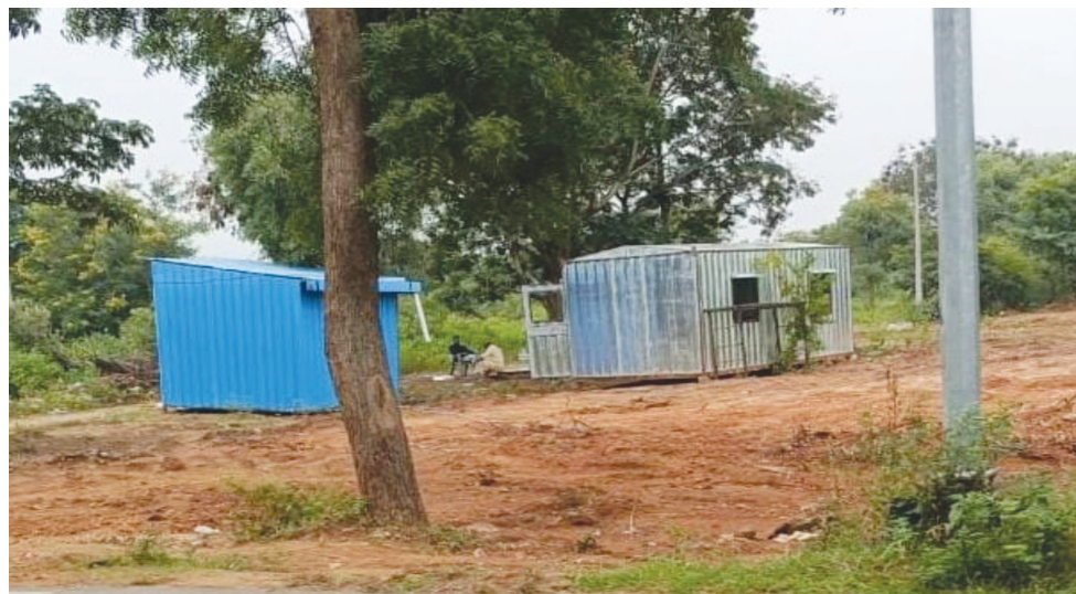
అధికారులు జాలిచూపిస్తున్న అక్రమ కంటైనర్లు..227 ప్రభుత్వ భూమిలో..