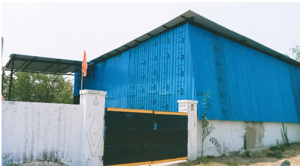
227 ప్రభుత్వ భూమిలో నోటీసులు ఇచ్చి, చర్యలు తీసుకోని, 400 గజాల్లో అక్రమ షెడ్డు..