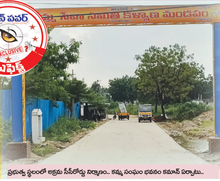
ప్రభుత్వ స్థలంలో అక్రమ సీసీరోడ్డు నిర్మాణం.. కమ్మ సంఘం భవనం కమాన్ ఏర్పాటు..