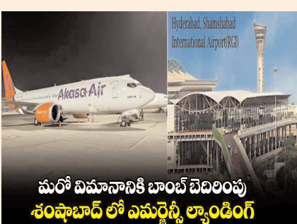
మరో విమానానికి బాంబ్ బెదిరింపు శంషాబాద్ లో ఎమర్జెన్సీ ల్యాండ్లింగ్

హైదరాబాద్ పెన్ పవర్:చేశంలో విమానాలకు బాంబ్ బెదిరింపుల పర్వం కొనసాగుతోంది. గడిచిన వారం రోజుల్లో దాదాపు 80 విమానాలకు