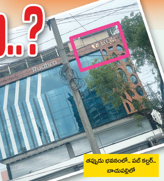
తప్పుడు భవనంలో.. పబ్ కల్చర్.. బాచుపల్లిలో