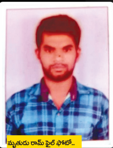
మృతుడు రామ్ ఫైల్ ఫోటో..