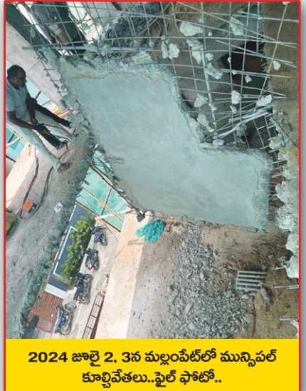
2024 జూలై 2, 3న మల్లంపేట్లో మున్సిపల్ కూల్చివేతలు.. ఫైల్ ఫోటో..