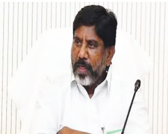
రూ.56,440 కోట్లు చెల్లించినట్లు తెలిపింది.

హైదరాబాద్ పెన్ పవర్: తమ ప్రభుత్వం వచ్చిన ఈ పది నెలల కాలంలో రూ.56 వేల కోట్లకు పైగా పాత అప్పులు, వడ్డీలను చెల్లించామని ఉపముఖ్యమంత్రి మల్లు భట్టివిక్రమార్క వెల్లడించారు. ఇదే కాలంలో రూ.49 వేల కోట్ల రుణాలు తీసుకున్నామన్నారు. రాష్ట్ర ప్రభుత్వం అప్పులు, వ్యయంపై ఉపముఖ్యమంత్రి కార్యాలయం ఓ ప్రకటనను విడుదల చేసింది. 2023 డిసెంబర్ నుంచి 2024 అక్టోబర్ 15 వరకు అప్పులు, ఆదాయం, ఖర్చుల వివరాలను అందులో పేర్కొంది. అక్టోబర్ 15 వరకు ప్రభుత్వం తీసుకున్న రుణాల మొత్తం రూ.49,618 కోట్లుగా ఉందని తెలిపింది. పాత అప్పులు, వడ్డీల కోసం