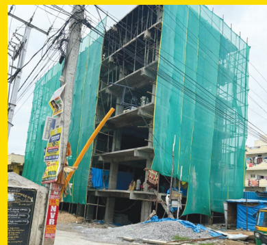
గత జూలై నెలలో ప్రణీత కన్స్ట్రక్షన్ ఐదంస్తుల అక్రమ కట్టడం.. పాత చిత్రం..