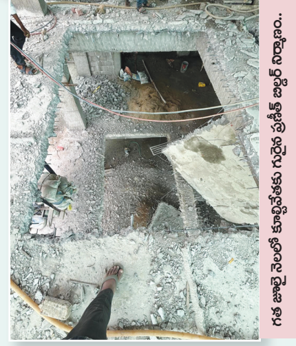
గత జూలై నెలలో కూల్చివేతకు గురైన ప్రణీత బల్డర్ నిర్మాణం..