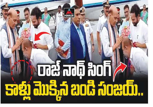
రాజ్ నాథ్ సింగ్ కాళ్లు మొక్కిన బండి సంజయ్..

హైదరాబాద్ పెన్ పవర్: కేంద్ర సహాయమంత్రి, తెలంగాణ బీజేపీ సీనియర్ నేత బండి సంజయ్ కేంద్ర రక్షణ శాఖ మంత్రి రాజ్‌నాథ్ సింగ్ కాళ్లు మొక్కారు. వికారాబాద్ జిల్లా దామగుండం రిజర్వ్ ఫాస్ట్‌లో రాడార్ శంకుస్థాపన కార్యక్రమం కోసం రాజ్‌నాథ్ సింగ్ వచ్చారు. హైదరాబాద్ చేరుకున్న కేంద్ర రక్షణ శాఖ మంత్రికి కేంద్రమంత్రి కిషన్ రెడ్డి, బండి సంజయ్ ఘన స్వాగతం పలికారు. కిషన్ రెడ్డి పుష్పగుచ్ఛం ఇచ్చి స్వాగతం పలికారు. కేంద్రమంత్రికి శాలువా కప్పిన బండి సంజయ్.. అంతకుముందు ఆయన పాదాలను తాకారు.