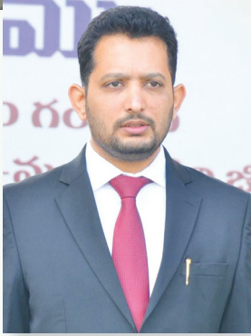
గౌతమ్ పోట్లు.. మేడ్చల్ మల్కాజగిరి జిల్లా కలెక్టర్..

మేడ్చల్ జిల్లా బ్యూరో, పెన్ పవర్, అక్టోబర్ 15: గ్రూప్-1 మెయిన్స్ పరీక్షలు హైదరాబాద్, రంగారెడ్డి, మేడ్చల్-మల్కాజగిరి జిల్లాల్లో గుర్తించబడిన 46 పరీక్షా కేంద్రాల్లో 21/10/2024 నుండి 27/10/2024 వరకు మధ్యాహ్నం 2 నుండి సాయంత్రం 5 గంటల వరకు నిర్వహించును. మేడ్చల్ మల్కాజగిరి జిల్లా కలెక్టర్ గౌతమ్ ఓ ప్రకటనలో తెలిపారు. అభ్యర్థులు హాల్ టికెట్లు డౌన్లోడ్ చేసుకొనేందుకు 14.10.2024 నుండి ఆన్లైన్ లో అందుబాటులో ఉంచబడ్డాయని కలెక్టర్ సూచించారు. అభ్యర్థులను మధ్యాహ్నం 12:30 గంటల నుంచి పరీక్షా కేంద్రంలోకి అనుమతిస్తారని, పరీక్షా కేంద్రం గేట్లు మధ్యాహ్నం 1:30 గంటలకు మూసివేయబడతాయని, తర్వాత అభ్యర్థులు ఎవరినీ పరీక్షా కేంద్రంలోకి అనుమతించబడదని కలెక్టర్ స్పష్టతను తెలిపారు.. మొదటి పరీక్షకు ఉపయోగించిన అదే హాల్ టికెట్లను మిగిలిన ఆరు పరీక్షలకు (అంటే 21-10-2024 నుండి 27-10-2024 వరకు) ఉపయోగించాలని, సూచించారు..