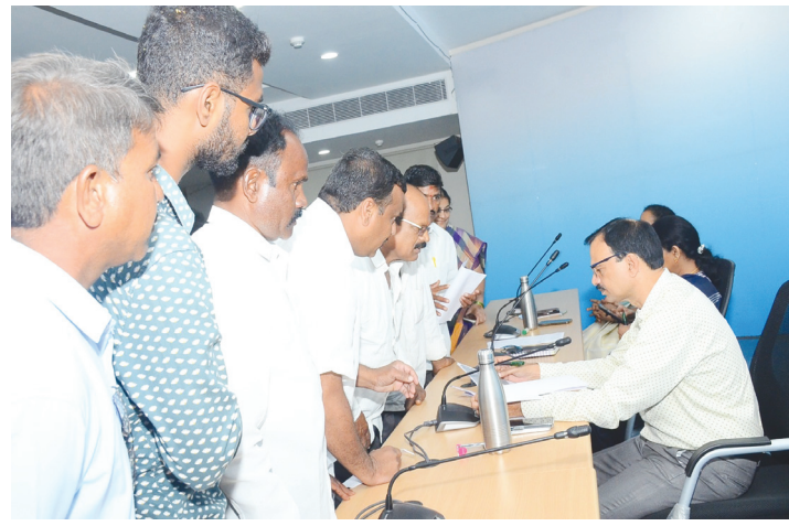
ఫిర్యాదు దారుల వినతులు పరిశీలిస్తున్న అదనపు కలెక్టర్..