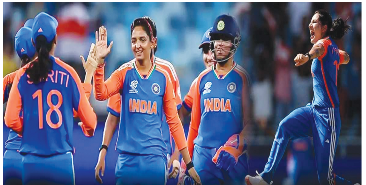
దాటింది. అరూబ్ షా 14 చేసి పర్యాలేదనిపించింది. ఈ మ్యాచ్ లో భారత్ రన్ రేట్ తో గెలవడం చాలా కీలకం. గ్రూప్ మ్యాచ్ లో భాగంగా తొలి మ్యాచ్ లో న్యూజిలాండ్ పై 58 పరుగుల భారీ తేడాతో ఓడిపోయి పాయింట్ల పట్టికలో చివర్లో నిలిచింది. దీంతో సెమీస్ రేస్ ఆసక్తికరంగా మారింది.

హైదరాబాద్ పెన్ పవర్: టీ20 వరల్డ్ కప్ లో భారత మహిళల జట్టు బౌలింగ్ లో అదరగొట్టింది. తొలి మ్యాచ్ లో న్యూజిలాండ్ పై భారీ తేడాతో ఓడిపోయిన మన జట్టు.. దాయాధి పాకిస్తాన్ పై సత్తా చాటింది. బౌలర్లందరూ క్రమశిక్షణతో.. సమిష్టిగా బౌలింగ్ చేయడంతో పాకిస్తాన్ నిర్ణీత 20 ఓవర్లలో 8 వికెట్ల నష్టానికి 105 పరుగులు మాత్రమే చేరుకులింది. 28 పరుగులు చేసిన నిదా దార్ టాప్ స్కోరర్ గా నిలిచింది. భారత బౌలర్లలో అరుంధతి రెడ్డి మూడు.. ప్రేయాంక పాటిల్ 2 వికెట్ల పదగట్టారు. రేణుకా రాకూర్, దీప్తి శర్మ, ఆశ శోభన్ లకు తలో వికెట్ లభించింది. టాప్ గెలిచి బ్యాటింగ్ ఎంచుకున్న పాకిస్తాన్ కు సరైన ఆరంభం దక్కలేదు. తొలి ఓవర్ చివరి బంతికి రేణుకా రాకూర్ పాక్ ఓపెనర్ ఫిరోజ్ ను డకౌట్ చేసింది. ఆ తర్వాత క్రీజ్ లోకి వచ్చిన అమీన్, సోఫాల్ సింగిల్ డిజిట్ కే పరిమితమయ్యారు. క్రీజ్ లో ఉన్నత సేపు ఇబంది పద్ద ముసీబా అలీ 26 బంతుల్లో 17 పరుగులు చేసి ఔటయింది. పాక్ వరుస విరామాల్లో వికెట్లతోనే వచ్చింది. సినియర్ ప్లేయర్ నిదా దార్ భారత బౌలర్లను ప్రతిఘటించడంతో పాకిస్తాన్ 100 పరుగుల స్కోర్