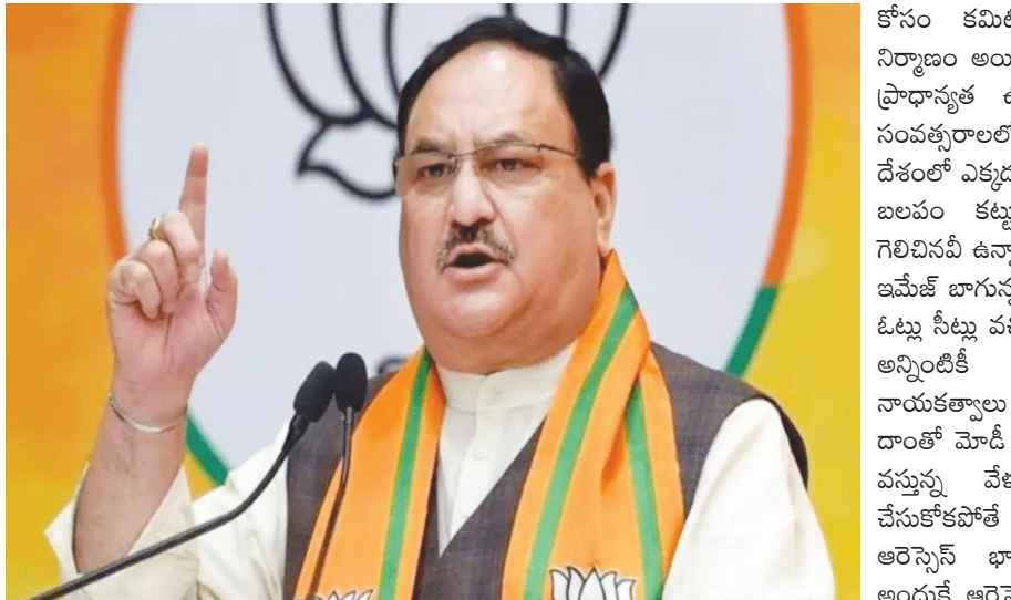
మాత్రం తమ మాట వినే మరో వ్యక్తికి ఆ చాన్స్ ఇవ్వాలని అనుకుంటున్నారు అని ప్రచారం సాగుతోంది. దాంతోనే నడ్డా స్థానంలో కొత్తవారిని ఎంపిక చేసే కార్యక్రమం అలా వాయిదా పడుతోంది అని అంటున్నారు. ఇక బీజేపీ గ్రాస్ రూల్ లెవెల్ నుంచి గట్టిగా పునరుత్తేజం పొందాలని వ్యక్తి పూజా మోడీ ఇమేజ్ తో ఇన్వార్తూ పార్టీ నెట్టుకుని వచ్చినా సమిష్టి నాయకత్వమే బీజేపీకి ఎప్పటికీ బలం అన్నది ఆరెస్టెస్ మాటగా ఉంది. %శాత్రీంశీ =మున% - ప్రతిపక్షాలకు రేపంట్ బంపర్ ఆఫర్.. మూసీ బాధితుల

హైదరాబాద్ పెన్ పవర్: కేంద్రంలో అధికారంలో ఉన్న బీజేపీ ప్రభుత్వానికి మార్గదర్శిగా మాతృ సంస్థగా ఆరెస్టెస్ ని చెబుతారు. ఆరెస్టెస్ కి ఎన్నో అనుబంధాలు ఉన్నాయి. వాటిని అన్నింటినీ సంఘ పరివార్ గా పిలుస్తారు. అందులో రాజకీయ అంగంగా బీజేపీ ఉంది. అయితే ప్రస్తుతం బీజేపీ పెద్దలకు ఆరెస్టెస్ కి మధ్య గ్యాప్ ఉందా అన్న చర్చ కూడా సాగుతోంది. దేశంలో కుల గణన చేపట్టాలని ఆరెస్టెస్ కూడా కోరుతోంది. ఈ నిన్నాన్ని డిమాండ్ గా చేసి బదుగు అణగారిన వర్గాలలో మద్దతుని కాంగ్రెస్ అగ్ర నేత రాహుల్ గాంధీ సంపాదిస్తున్నారు. ఆయా వర్గాలలో ఆయాచితంగా ఆయనకు అనుకూలత రావడానికి బీజేపీ పెద్దల సాచివేత ధోరణి కారణం అని కూడా ఆరెస్టెస్ భావిస్తోంది. దీని వలన బీజేపీకి ఇబ్బందులు వస్తాయని కూడా ఊహిస్తోంది. కుల గణన డిమాండ్ వల్ల దేశంలోని అత్యధికులు కాంగ్రెస్ వైపు మళ్లుతారని కూడా ఆరెస్టెస్ అంచనా కడుతోంది. మరో వైపు కుల గణన చేపడితే తమకు ఎలాంటి అభ్యుత్తరం లేదని కూడా ఇటీవల కేరళలో జరిగిన ఆరెస్టెస్ సమావేశంలో పెద్దలు గట్టిగానే స్పష్టం ఇచ్చారు. ఇక ఆరెస్టెస్ బీజేపీని సంస్కరించాలని చూస్తోంది అంటున్నారు. బీజేపీ బలపడాలి అంటే పటిష్టమైన నాయకత్వం అవసరం అని భావిస్తోంది. జేపీ నడ్డా ప్రస్తుతం జాతీయ అధ్యక్షుడిగా ఉన్నారు ఆయనను నాలుగు నెలల క్రితం కేంద్ర మంత్రి మండలిలోకి తీసుకున్నారు. అయినా ఆయననే బీజేపీ చీఫ్ గా కొనసాగిస్తున్నారు. %శాత్రీంశీ =మున% - తగ్గేదేలే అంటున్న నాగార్జున.. వెనకుండి నడిపిస్తున్నదెవరు..? అయితే నడ్డా ప్లేస్ లో ఆరెస్టెస్ భావజాలం ఉన్న వారిని తెచ్చి పెట్టాలని సంఘ పెద్దలు భావిస్తున్నారు అని అంటున్నారు. అయితే బీజేపీ పెద్దలు