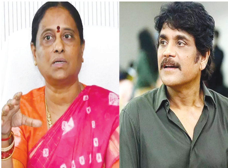
ద్వారా జరిగిన నష్టాన్ని.. సురేఖ వ్యాఖ్యలతో కాంగ్రెస్ ప్రభుత్వాన్ని టార్గెట్ చేయాలనే దృఢ నిశ్చయంతో ఉన్నారు. %శాత్రీంశీ =మున% - ప్రతిపక్షాలకు రేపంట్ బంపర్ ఆఫర్.. మూసీ బాధితుల కోసం కమిటీ.. అందుకే.. నాగార్జున ఎవరు చెప్పిన కూడా వినడం

హైదరాబాద్ పెన్ పవర్: తెలంగాణ రాష్ట్రవ్యాప్తంగా మంత్రి కొందా సురేఖ, సినీనటుడు నాగార్జున మధ్య నెలకొన్న వివాదం చర్చకు దారితీసిన విషయం తెలిసిందే. అటు రాజకీయపరంగానూ ప్రకంపనలు సృష్టించింది. ఇక.. సురేఖ వ్యాఖ్యలను ఖండిస్తూ సినీలోకం అంతా ఏకమైంది. ఎక్కడిక్కడ వాళ్లు వీళ్లు అనే తేడా లేకుండా అందరూ ముక్తకంఠంతో తప్పుబట్టారు. ఈ విషయంలో కింగ్ నాగార్జున, ఆయన ఫ్యామిలీ కూడా అంతో సీరియస్ గా ఉంది. నాగార్జున కూడా ఎక్కడా తగ్గడం లేదు. సురేఖపై ఇంకా ఆయన అదే ఆగ్రహంతో ఉన్నట్లు తెలుస్తోంది. సురేఖ క్షమాపణలు కోరనప్పటికీ.. పీసీసీ చీఫ్ అప్పీల్ చేసినప్పటికీ వాటిని లెక్క చేయడం లేదన నమాచారం. సురేఖ నాగచైతన్య-సమంతల విదాకులపై చేసిన వ్యాఖ్యలను వారి మనోభావాలను దెబ్బతీశారు. దాంతో ఇప్పటికే నాగార్జున సురేఖ క్రిమినల్ కేసు పెట్టడమే కాకుండా పరువునష్టం దావా కూడా వేశారు. అయితే.. నాగార్జున ఇంత కోపం వెనుక 'ఎన్ కన్వెన్షన్' కూల్చివేత కూడా ఉన్నట్లుగా తెలుస్తోంది. అందుకే.. ఆయన ఈ ఇమ్మ్యూని ఇంత సీరియస్ గా తీసుకున్నారని టాక్ నడుస్తోంది. %శాత్రీంశీ =మున% - పెన్సిల్వేనియా ప్రచార సభలో బ్రంట్ పై ఎలాన్ మస్కో సెన్సేషనల్ కామెంట్స్.. ఏకపక్షంగా వ్యవహరించి తన ఎన్ కన్వెన్షన్ కాంగ్రెస్ ప్రభుత్వం కూల్చివేయడంపై కోపం నాగార్జునలో మొదటి నుంచి ఉంది. తాను ఆక్రమించి నిర్మించలేదని చెప్పినప్పటికీ ప్రభుత్వం వినకుండా నేలమట్టం చేసిందని ఆయన వాదన. దాంతో.. ప్రభుత్వంలో ఉన్న మంత్రి ఒక్కసారిగా ఆయన గురించి తీవ్ర వ్యాఖ్యలు చేయడంతో దొరికిందే చాన్స్ అన్నట్లుగా నాగార్జున వ్యవహరిస్తున్నారని ప్రచారం జరుగుతోంది. ఎన్ కన్వెన్షన్