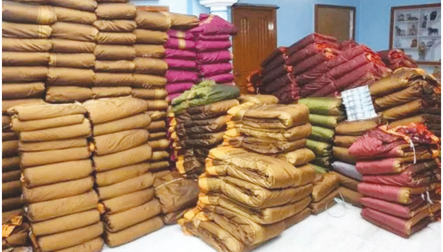
ముఖ్యమంత్రి రేపంట్ రెడ్డి చాలా సందర్భాల్లో ఆరోపించారు. వాటికి సంబంధించి విచారణ సైతం కొనసాగుతోందని చెప్పుకోవచ్చు. దాంతో ఈ ఏడాది నేతన్నలకు బతుకమ్మ చీరల కాంట్రాక్ట్ ఇవ్వలేదు. నేతన్నలు కూడా బతుకమ్మ చీరలను తయారుచేయలేదు. %శాత్రీంశీ

హైదరాబాద్ పెన్ పవర్: తెలంగాణ రాష్ట్రంలో బతుకమ్మ పండుగకు ఉన్న ప్రాధాన్యం అంతాఇంతా కాదు. ఏటా మహిళలంతా బతుకమ్మ పండుగ కోసం ఎదురుచూస్తుంటారు. తొమ్మిది రోజులపాటు అంతా ఒకదగ్గర చేరి ఆడిపాడుతుంటారు. ఇప్పటికే రాష్ట్రమంతటా బతుకమ్మ ఉత్సవాలు వైభవంగా కొనసాగుతున్నాయి. మరో నాలుగు రోజుల్లో సద్దుల బతుకమ్మను కూడా జరుపుకోబోతున్నారు. ఈ క్రమంలో రేపంట్ సర్కార్ పై మహిళల్లో ఒకింత చర్చ నడుస్తోంది. ఏటా బతుకమ్మ పండుగ వస్తోందంటే ప్రభుత్వం తరఫున రేపన్ కార్డులు కలిగిన మహిళలకు చీరలు పంపిణీ చేసేవారు. ఒక్కో మహిళకు ఒక్కో చీరను అందించేవారు. అలా తెలంగాణ ప్రత్యేక రాష్ట్రం ఏర్పాటు నుంచి ఇస్తున్నారు. అంటే పదేళ్లుగా మహిళలకు చీరలు అందిస్తున్నారు. ఆడబిడ్డకు బతుకమ్మ కానుక అంటూ గత బీఆర్ఎస్ ప్రభుత్వం చీరలను అందించింది. ఏటా బతుకమ్మ ఉత్సవాలు ప్రారంభంలోనే మహిళలకు చీరలు అందేలా చర్యలు తీసుకునే వారు. %శాత్రీంశీ =మున% - పెన్సిల్వేనియా ప్రచార సభలో బ్రంట్ పై ఎలాన్ మస్కో సెన్సేషనల్ కామెంట్స్.. అయితే.. పదేళ్ల తరువాత రాష్ట్రంలో కాంగ్రెస్ ప్రభుత్వం కొలువుదీరింది. వచ్చినప్పటి నుంచి ఆయా స్థాయిలను అమలు చేస్తున్నప్పటికీ బతుకమ్మ చీరలను పక్కన పెట్టేశారు. గత ప్రభుత్వం హయాంలో చీరల పథకంలో పెద్ద ఎత్తున అవకతవకలు జరిగాయని