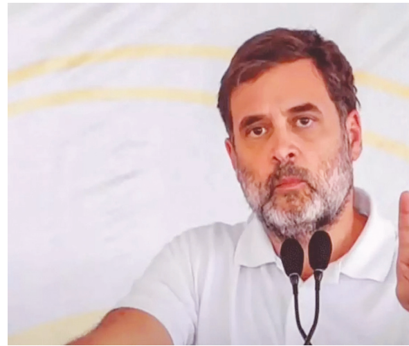
హైదరాబాద్ పెన్ పవర్: కాంగ్రెస్ అగ్రనేత.. లోక్సభ ఎంపీ రాహుల్ గాంధీ.. శనివారం నాడు మహారాష్ట్రలోని కొల్హాపూర్ లో పర్యటించారు. ఈ నేపథ్యంగా అక్కడ చలతశిబిజీ మహారాష్ట్ర

విగ్రహాన్ని ఆవిష్కరించారు. అనంతరం జరిగిన 'సంవిధాన్ సమ్మాన్ సమ్మేళన్' లో మాట్లాడిన రాహుల్ గాంధీ.. రిజర్వేషన్ల అంశం ప్రస్తావించారు. రిజర్వేషన్లపై 50% పరిమితిని తొలగించాలని.. తద్వారా రాజ్యాంగం పరిరక్షణ సాధ్యమవుతుందని ఆయన పేర్కొన్నారు. అంతేకాదు ఈ మేరకు పార్లమెంట్లో బిల్లు ఆమోదానికి కూడా ఇండియా కూటమి చర్యలు చేపట్టాతున్నట్లు స్పష్టం చేశారు. అంతలేని విధ్వంసం రాజ్యాంగం ప్రజలను రక్షించడానికి ఉంది.. అంతేకానీ భయభ్రాంతులను చేయడానికి కాదు. రాజ్యాంగాన్ని వ్యవస్థని నాశనం చేసి.. శివాజీకి క్షమాపణలు చెప్పడం వల్ల ఎవరికి ఎలాంటి ప్రయోజనం చేకూరదు అంటూ మోడీ పై విమర్శలు కురిపించారు. మహారాష్ట్రలోని సింధ్ మర్కెట్లో ఇటీవల చలతశిబిజీ భారీ విగ్రహం కూలిన ఘటనకు మోడీ క్షమాపణలు చెప్పిన విషయాన్ని మహారాష్ట్ర రాహుల్ గాంధీ ప్రస్తావించారు.