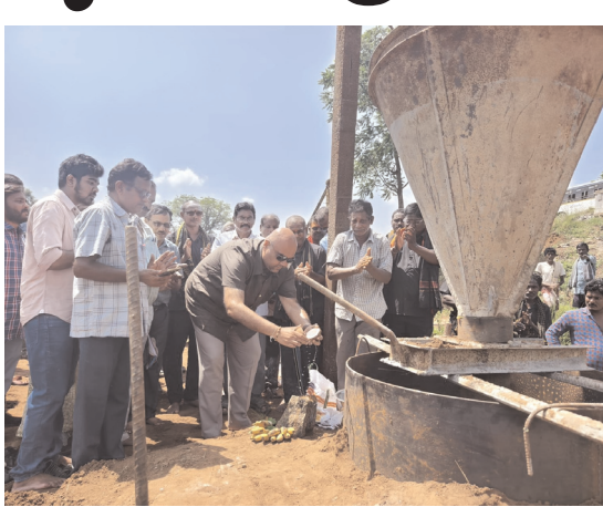
గ్రామ పెద్దలు, ప్రజలు మరియు ఆర్ %%% బి అధికారులు పాల్గొన్నారు.

బొబ్బిలి పెన్ పవర్ అక్టోబర్ 4: బొబ్బిలి మండలం, పారాది గ్రామం వద్ద వేగావతి నదిపై వంతెన నిర్మాణానికి ఎమ్మెల్యే ఆర్.పి.ఎస్.కే.కే. రంగారావు (బీబీ నాయన) చేతులమీదుగా పనులు ప్రారంభించారు. మాజీ మంత్రి సుజయ్ కృష్ణ రంగారావు గౌరవోపహారం చేశారు. వంతెన నిర్మాణం చేయాలని నిధులకు అదనంగా 6 శాతం జీఎస్టీ మరియు డ్రైవర్స్ రోడ్డుకి కలిపి ఇప్పుడు రూ. 13,40,00,000 తో నిర్మాణం ప్రారంభించారు. రెండు రాష్ట్రాల రహదారులకు ప్రధాన మార్గం అయిన ఈ వంతెన యొక్క సమస్య తీవ్రతను ఎమ్మెల్యే బీబీనాయన రాష్ట్ర ముఖ్యమంత్రి నారా చంద్రబాబు నాయుడుని కలిసి వివరించి, త్వరితగతిన నిధులు మంజూరు అయ్యేలా సహకరించాలని కోరారు.