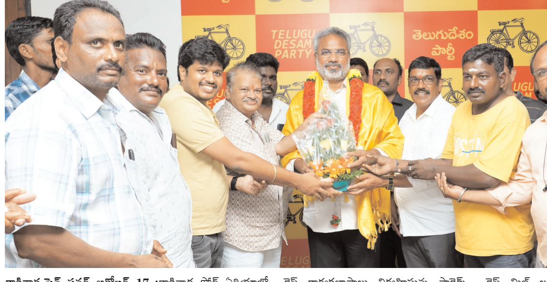
కాకినాడ, పెన్ పవర్ అక్టోబర్ 17 : కాకినాడ పోర్ట్ ఏరియాలో రైస్ కార్యకలాపాలు నిర్వహిస్తున్న సార్వేక్స్ రైస్ మిల్ ల