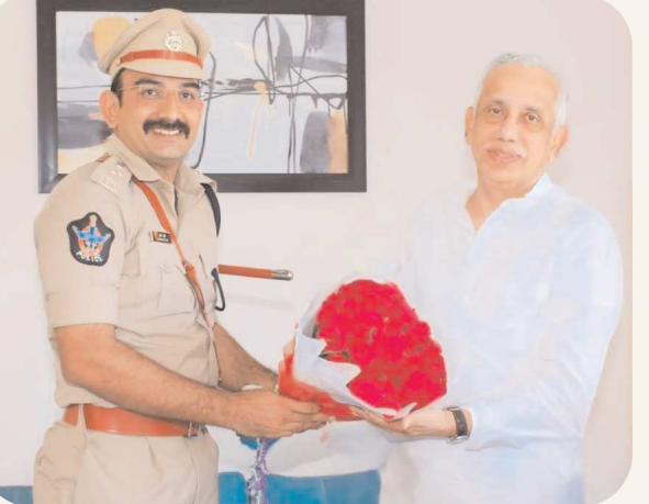
పెన్ పవర్ స్టాఫ్ రిపోర్టర్ బాపట్ల అక్టోబర్ 8: