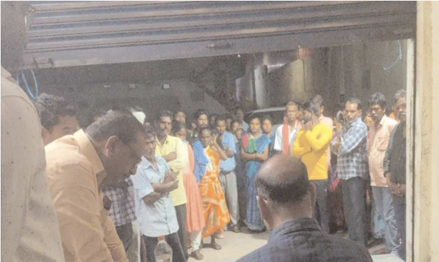
చిలకలూరిపేట పెన్ పవర్ ప్రతినిధి అక్టోబర్ 08

పరిసరాలు పరిశుభ్రంగా ఉండే విధంగా చూసుకోవాలి