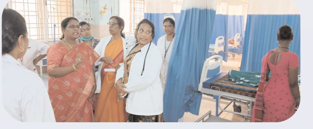
పలమనేరు అక్టోబర్ 08 (పెన్ పవర్):