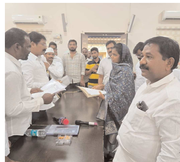
గిద్దలూరులో ఏర్పాటు చేయాలని ఎంపీ మాగుంట ను ఎమ్మెల్యే కోరారు. ఎమ్మెల్యే ఆశోక్ రెడ్డి అడిగిన సైనిక స్కూల్ ప్రశ్నకు ఎంపీ మాగుంట బదులిస్తూ.. గిద్దలూరులో సొంత నిధులతో ప్రైవేట్ స్కూల్ ఏర్పాటు

చేయుటకు ముందుకు వచ్చారు ఎంపీ మాగుంట సొంత నిధులతో గిద్దలూరు నియోజకవర్గంలో స్కూల్ ఏర్పాటు చేయుటకు ముందు రావటంతో ఎంపీ మాగుంట కు ఆశోక్ రెడ్డి కృతజ్ఞతలు తెలిపారు నియోజకవర్గంలో ఎన్ ఆర్ జె సి పనులలో క్రియేట్ అయ్యే వెటిరియన్ కాంపౌనెంట్ నిధులను నియోజకవర్గంలో కేటాయించాలన్నారు. నియోజకవర్గం అభివృద్ధి చెందాలంటే ప్రత్యేక రాయితీలు.. నిధులు ఇవ్వాలన్నారు గిద్దలూరుని వెనుక బడిన నియోజకవర్గంగా రాష్ట్ర ప్రభుత్వం గుర్తించాలని కోరారు . పశ్చిమ ప్రాంతం అభివృద్ధి చెందలంటే స్పేషల్ ఇన్వెస్ట్ ప్రకటిస్తే.. పెట్టుబడుదారులు ముందుకు వస్తారని, అదిచగా ప్రభుత్వం అడుగులు వేయాలన్నారు. గత జల జీవన్ పథకంలో గత ప్రభుత్వ కంట్రాక్టర్స్ పనులు చేయకుండా వెళ్ళారని టెండర్స్ పనులు పూర్తి చేయలేదని ఆరోపించారు. తాగు నీటి సమస్య అదొక కారణంగా ఉంది.. అవసరం అయితే పాత టెండర్స్ ను క్యాన్సిల్ చేయాలన్నారు. గత ప్రభుత్వంలో గిద్దలూరు నియోజకవర్గంలో వికలాంగుల పెంషన్ లో భాగిగా అవినీతి జరిగిందని.. అధికారులు వెంటనే దర్యాప్తు చేసి నిజమైన అర్హులకు పింఛన్లు అందించాలన్నారు. నియోజకవర్గంలో ఎక్కువగా ఫేక్ పత్రాలతో ఫింఛన్లు తీసుకుంటున్నారని ఎవరైతే అక్రమాలకు పాల్పడారో అధికారులు వారిపై చట్ట రిట్యా చర్యలు తీసుకొని నిజమైన అర్హులకు న్యాయం చేయాలని కోరారు.