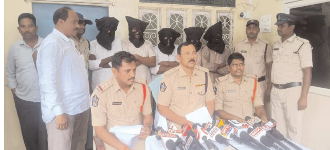
చిలకలూరిపేట పెన్ పవర్ ప్రతినిధి అక్టోబర్ 08 :

చాకచాక్యంతో కేసును చేధించిన రూరల్ సీబిఐ సుబ్బానాయుడు, సిబ్బందికి డీఎస్సీ అభినందనలు