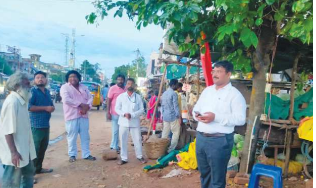
కుమార్ తెలిపారు. ఈ కార్యక్రమంలో మున్సిపల్ సిబ్బంది పోలీసులు పాల్గొని, ట్రాఫిక్ కి అంతరాయం లేకుండా చూడడం జరిగింది.