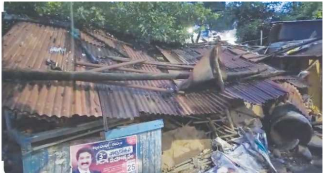
గిద్దలూరు పేన్ పవర్ అక్టోబర్ 17

తహశీల్దార్ కార్యాలయం వద్ద నోటీస్ ఇచ్చిన మరో బాంక్ ను కూడా తొలగించాలి!! తహశీల్దార్ కార్యాలయంలోకి వెళ్ళేటప్పుడు ఎడమ వైపు బంకుకు నోటీస్ ఇచ్చారు కానీ?? తహశీల్దార్ కార్యాలయం ఇరువైపులా ఖాళీ చేయాలి