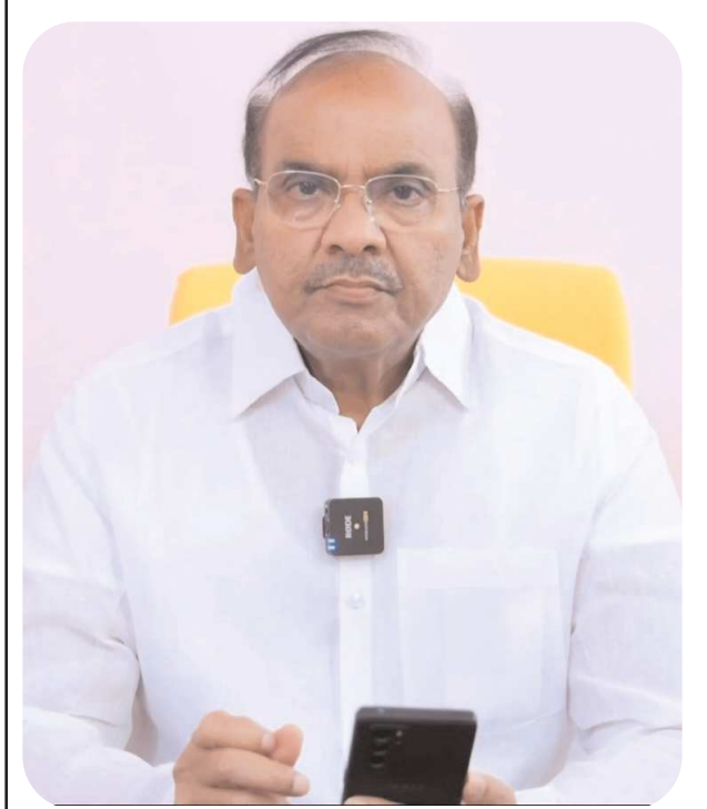
చిలకలూరిపేట పెన్ పవర్ ప్రతినిధి అక్టోబర్ 17

నియోజకవర్గం పరిధిలోని నిరుద్యోగులు, యువత కోసం ఈ నెల 19వ తేదీన మెగా జాబ్ మేళా నిర్వహించనున్నట్లు ప్రకటించారు మాజీమంత్రి, ఎమ్మెల్యే ప్రతిపాటి పుల్లారావు. చిలకలూరిపేట ప్రతిపాటి గార్డెన్స్ లో అక్టోబరు 19న ఉదయం 9 గంటలకు మెగా ఉద్యోగ మేళాను ప్రారంభిస్తున్నట్లు ఆయన తెలిపారు. ఈ మేరకు గురువారం ఒక ప్రకటన విడుదల చేసిన ఎమ్మెల్యే ప్రతిపాటి నిరుద్యోగ యువతీయువకులు, 2016-2024 మధ్య ఉత్పత్తిలైన వారందరూ ఈ సదాపకాశాన్ని సద్వినియోగం చేసుకోవాలని కోరారు. ఉద్యోగం కావాలని అడుగుతున్న యువకుల సంఖ్య రోజురోజుకీ పెరుగుతుందని, అందుకనే వారికోసం ఈ ఉద్యోగ మేళాను నిర్వహిస్తున్నామని చెప్పారు. నియోజకవర్గం వ్యాప్తంగా ఉన్న పదో తరగతి ఉత్పత్తిలైనా, ఫెయిలైనా, బిటీబి డిప్లొమా గానీ ఇంటర్ పూర్తయిన వారితో పాటు డిగ్రీ బీటెక్, ఎంటెక్, పీజీలు, ఫార్మా చదివిన వారంతా ఈ ఉద్యోగ మేళాకు హాజరుకావచ్చని తెలిపారు. ఈ ఉద్యోగ మేళాను అర్హులైన ప్రతిఒక్కరూ సద్వినియోగం చేసుకోవాలని పిలుపునిచ్చారు. 30కి పైగా కంపెనీలు 1000కి అధికంగా ఈ జాబ్ మేళాకు హాజరువుతున్నాయని తెలిపారు.