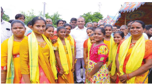
అవిష్కరించారు. ఎండుగుంపాలెంలో రహదారులు, డ్రైన్ నిర్మాణ పనులకు భూమిపూజ చేసి శిలాఫలకాలను అవిష్కరించారు. రూ.55 లక్షల