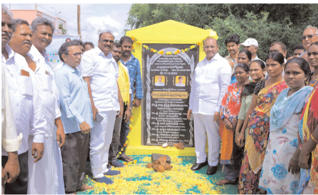
చిలకలూరిపేట పెన్ పవర్ ప్రతినిధి అక్టోబర్ 17:

గోపాళంవారిపాలెం, ఎండుగుంపాలెంలో పల్లె పండగలో పాల్గొన్న ప్రతిపాటి