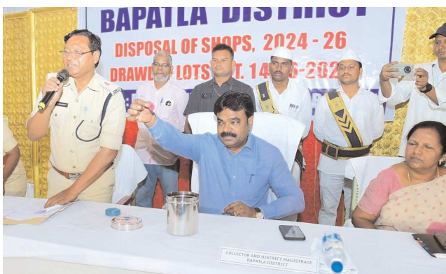
పెన్ పవర్ స్టాన్ రిపోర్టర్ బాపట్ల అక్టోబర్ 14:

మధ్యం దుకాణాల టెండర్ ప్రక్రియ సోమవారం స్థానిక ఎం ఎస్ ఆర్ కళ్యాణ మండపంలో జరిగింది. మధ్యం దుకాణాలకు అత్యధికంగా టెండర్లు రావడంతో ఎక్స్ట్రా శాఖ అధికారులు రెండు కొంటర్లను ఏర్పాటు చేశారు. ఒక కొంటర్ వద్ద జిల్లా కలెక్టర్ వెంకట మురళి హాజరు కాగా అధికారులు టెండర్ బాక్స్ లను తెరిచారు. మరొక కొంటర్ వద్ద జిల్లా సంయుక్త కలెక్టర్ ప్రభు శైవ్ హాజరు కాగా ఎక్స్ట్రా అధికారులు టెండర్ బాక్స్ లను తెరిచారు. బాపట్ల జిల్లాలో 117 దుకాణాలకు 2,149 దరఖాస్తులు వచ్చాయని ఎక్స్ట్రా శాఖ అధికారులు ప్రకటించారు. అనంతరం ఒక్కొక్క దుకాణానికి అత్యంత పారదర్శకంగా లాటరీ నిర్వహించారు. లాటరీ పద్ధతిలో దుకాణాలను కేటాయిస్తూ జిల్లా కలెక్టర్ ఉత్తర్వులు జారీ చేశారు. అందరికీ ఆమోదయోగ్యంగా, ప్రజల శ్రేయస్సును కోరుతూ మధ్యం దుకాణాల కేటాయింపులలో అందరికీ సమాన అవకాశం కల్పిస్తున్నట్లు