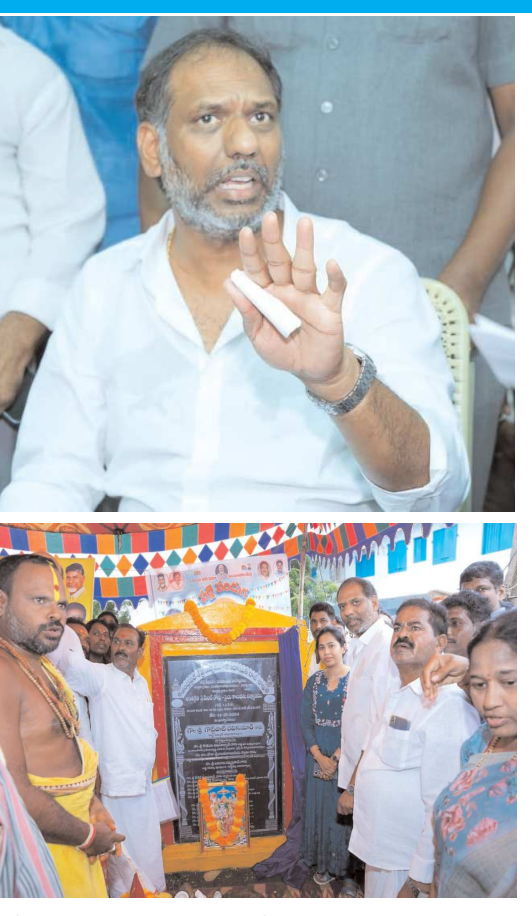
రోజు 13,326 పంచాయతీ గ్రామసభలు, అభివృద్ధి పనులకు తీర్మానాలు చేయడం చరిత్రాత్మక విషయం