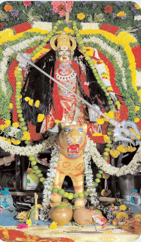
పెన్ పవర్ పెద్ద డోర్నల్ సెప్టెంబర్ 13

పట్టణంలోని శ్రీ వాసవి కన్యకా పరమశి ఆలయంలో ముగింపు సందర్భంగా ఆదివారం రాత్రి శ్రీ వాసవి మాత పులి వాహనంపై ప్రతిష్ఠించి విక్రమ్ పబ్లికేషన్స్ ఆధ్వర్యంలో విజయవాడ చెందిన రావికింది శ్రీనివాస్ తొలి కొబ్బరికాయను ఊరేగింపు కార్యక్రమాన్ని ప్రారంభించారు. పూర్వీకులలో అమ్మవారిని ఊరేగింపు కార్యక్రమం నిర్వహించారు ఈ సందర్భంగా భక్తులు మహిళలు భారీ సంఖ్యలో భక్తులు పాల్గొని శ్రీ వాసవి కన్యకా పరమేశ్వరి మాతను దర్శించుకున్నారు ఆలయ కమిటీ అధ్యక్షులలో నిర్వహించిన వివిధ వేషాధారాలతో కాలీమాత తో ఆకట్టుకున్నారు. భక్తులకు తీర్థ ప్రసాదాలు పంపించేకారం ఈ కార్యక్రమంలో ఆలయ కమిటీ సభ్యులు భక్తులు మహిళలు మరియు సంఖ్యలో పాల్గొన్నారు.