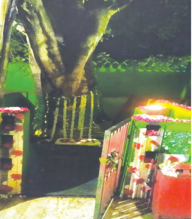
కొమరోలు పెన్ పవర్ అక్టోబర్ 14