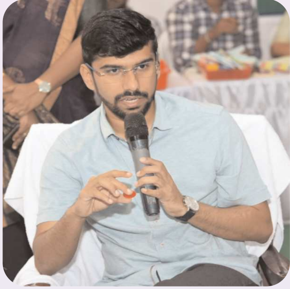
జ్యూరో పెన్ పవర్, నెల్లూరు అక్టోబర్ 14