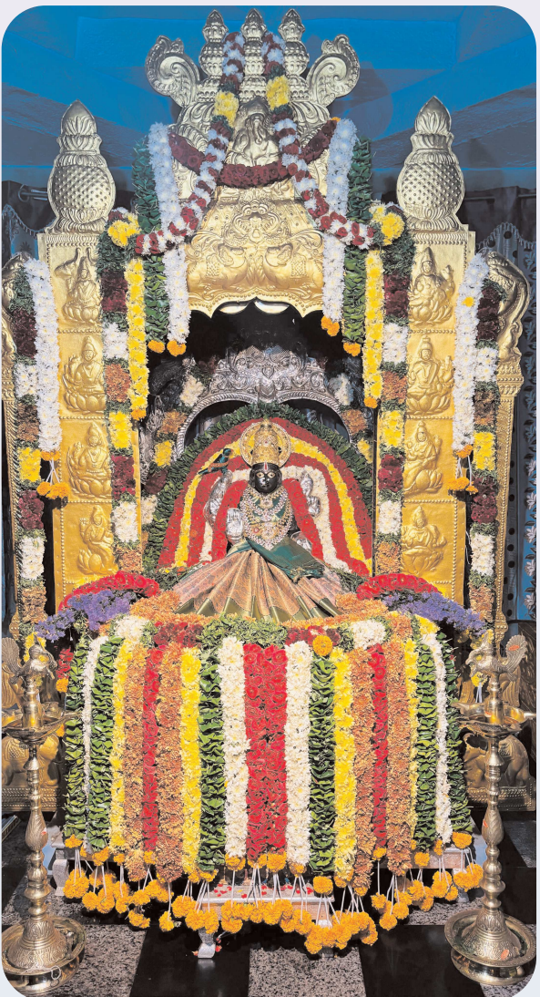
భారీ సంఖ్యలో పాల్గొన్న మహిళలు భక్తులు