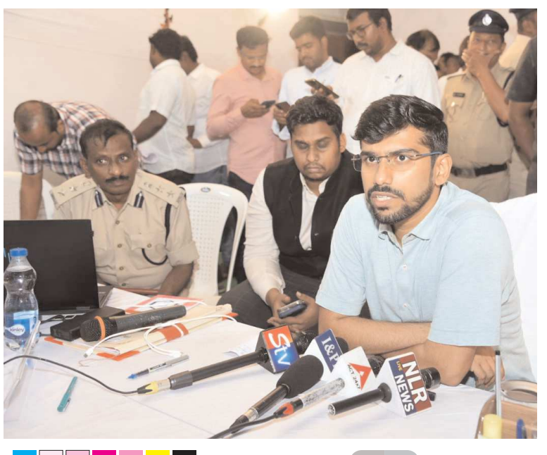
బ్యారో పెన్ పవర్, నెల్లూరు, అక్టోబర్ 14