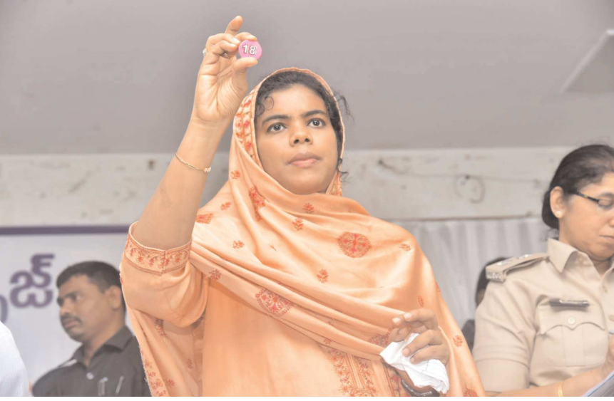
ఓంగోలు పెన్ పవర్ అక్టోబర్ 14