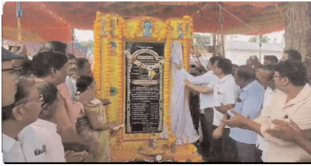
గిద్దలూరు పెన్ పవర్ అక్టోబర్ 14

కృష్ణంశెట్టి పల్లె, కంచినపల్లె పంచాయతీలలో రూ. 75 లక్షల రూపాయలతో నిర్మించనున్న సీసీ రోడ్లకు శంకుస్థాపన చేసిన ఎమ్మెల్యే ముత్తుముల