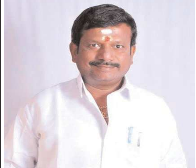
పెన్ పవర్ పామూరు అక్టోబర్ 13

శరణమల యాత్రలో వర్షపాత క్యూ టికెట్ తప్పనిసరి చేయడం జరిగినది. ఈ సందర్భంగా ఆయుష్షు స్వామి దేవస్థానం చైర్మన్ గుత్తి రాజా మాట్లాడుతూ నవంబర్ 16వ తేదీ నుండి ప్రారంభమవుతున్న మండల పూజలు మరియు మకర విలకు పూజల కోసం శరణమల ఆలయం నవంబర్ 16వ తారీఖున తెరవబడుతున్నది అయితే అక్కడి ప్రభుత్వం దర్శనమునకు వర్షపాత క్యూ టికెట్స్ రోజుకు 80000 కి పరిమితం చేసింది స్పాట్ బుకింగ్ ఎక్కడ కూడా లేకుండా కేవలం వర్షపాత క్యూ టికెట్స్ ను మాత్రమే అమలు చేయడం జరుగుతున్నది. దీని ద్వారా గ్రామాలలో ఉన్నటువంటి స్వాములకు ఈ విషయాలు తెలియక నేరుగా శరణమలకు వెళ్లడం జరుగుతుంది కాబట్టి గత సంవత్సరం అమలు పరిచిన విధంగానే స్పాట్ బుకింగ్ . ఈ సంవత్సరం కూడా అమలు చేయాలని శ్రీ ఆయుష్షు సేవా సమితి పామూరు వారి తరఫున కోరడం జరుగుతున్నది పంబ సీలక్యట్ మరియు ఏరుమేయాలి ప్రాంతాలలో స్పాట్ బుకింగ్ అమలు చేయడం జరుగుతున్నది. క్యూ టికెట్స్ లేకుండా వచ్చినటువంటి స్వాములు ఆ ప్రదేశంలో స్పాట్ బుకింగ్ చేసుకుని దర్శనమునకు వెళ్లడం జరుగుతుంది కాబట్టి అక్కడి ప్రభుత్వం ఈ విషయాన్ని గమనించి వర్షపాత కి టికెట్స్ తో పాటుగా స్పాట్ బుకింగ్ అని కూడా అమలు చేయవలసిందిగా కోరుతున్నాము.