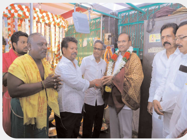
చిలకలూరిపేట పెన్ పవర్ ప్రతినిధి అక్టోబర్ 09 :