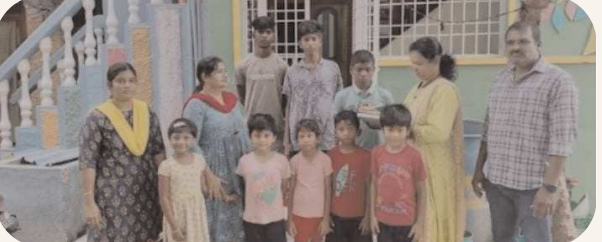
చిత్తూరు, పెన్ పవర్ అక్టోబర్ 09 :