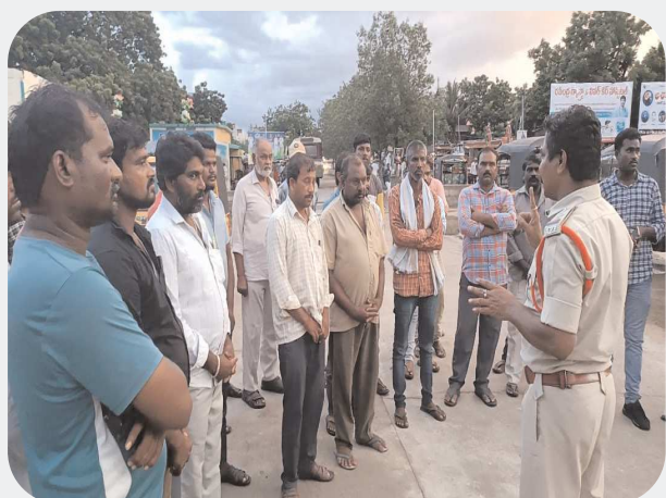
దొనకొండ అక్టోబర్ 09 పెన్ పవర్

మండలంలోని ఆటోలు నడుపుతున్న వారిని విలిపించి దొనకొండ రైల్వే స్టేషన్ సరాన్ లో ఆటో డ్రైవర్లకు ఆటో ఓనర్లకు కొద్దిపాటి మిసి లాబిలను అవగాహన కార్యక్రమం ఏర్పాటు చేశారు. ప్రకాశం జిల్లా దొనకొండ లో రైల్వే స్టేషన్ సమీపంలో ఆటోలు పరిమితికి మించి ప్రజలను ఎక్కించుకొని పోవటం మితిమీరి వేగంతో నడుపుతూ నిబంధనలకు విరుద్ధంగా ఉన్నట్లుంటే చట్టపరమైన తీసుకుంటామని వారికి పక్క నూచనలు అవగాహన కల్పించారు. నిబంధనలకు విరుద్ధంగా ఆటోలలో, ప్రైవేటు వాహనాల్లో పరిమితికి మించి వాహనాల్లో ప్యాసింజర్ ను గుంపులు గుంపులుగా ఎక్కించుకోకుండా అరత కలిగిన పత్రాలను బండ్లోనే ఉంచుకోవాలని అన్నారు. ప్రజల ప్రాణాలు ఎంతో ముఖ్యమైనవి నియమిత సంఖ్య కంటే ప్రయాణికులను ఎక్కించుకొని ప్రమాదాలకు కారణాలు కాకుండా ఉండాలన్నారు. ఈ కార్యక్రమంలో ఆటో డ్రైవర్లు ఓనర్లు మరియు పోలీస్ శాఖ సిబ్బంది తదితరులు పాల్గొంటున్నారు.