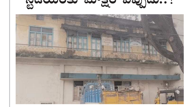
చిత్తూరు, పెన్ పవర్ అక్టోబర్ 09

చిత్తూరు నగరంలోని లక్ష్మీ నగర్ కాలనీలో ఉన్న ఇండోర్ స్టేడియం కు మోక్షం ఎప్పుడు..? జిల్లా క్రీడ ప్రాధికారి సంస్థ పాత భవనంలో ఇండోర్ స్టేడియం ఎన్నో సంవత్సరాలుగా అందుబాటులో ఉండేది.