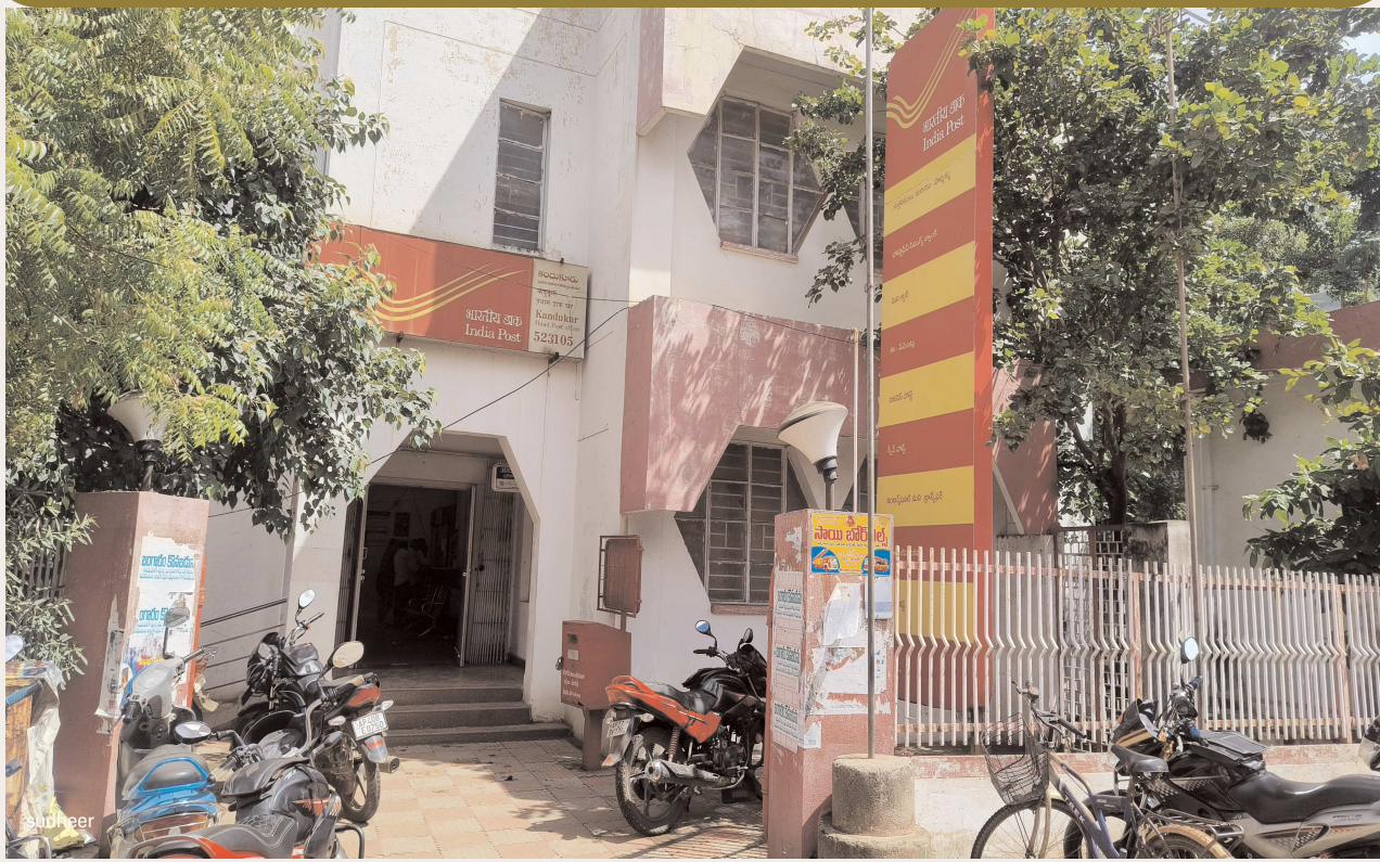
కందుకూరు పెన్ పవర్, అక్టోబర్ 9

తోకలేని పిట్ట ఎగరలేకపోతోంది.. 20 ఏళ్ల క్రితం ఎంతో ఆదరణ పొందిన, నిత్యజీవితంలో భాగమైన ఉత్తరం కనుమరుగైంది. ఎంతలా అంటే.. నేటి తరానికి ఉత్తరం ఎలా ఉంటుందో కూడా తెలియనంతగా దూరమైంది. సాంకేతిక పెరగడం, సెల్ఫోన్ వినియోగం విస్తృతమవడంతో ఉత్తరం మరుగున పడిపోయింది. సమాచారం తెలుసుకోవడానికి, పంపడానికి ఉత్తరం ద్వారా రోజుల తరబడి సమయం పట్టేది. నేడు క్షణాల్లో చేరవేస్తున్నారు. దీంతో ఉత్తరానికి ఆదరణ తగ్గి టెక్నాలజీ విస్తృతమైంది. గతంలో పండుగలు, ప్రత్యేక సందర్భాల్లో శుభాకాంక్షలు తెలుపుకోవడానికి, యోగక్షేమాలు, సమాచారం చేరవడానికి ఉత్తరం మధ్యవర్తిత్వం వహించేది. ఉత్తరం ద్వారానే వివరాలు తెలిసేవి. నాడు లేఖను ఆసక్తి చదివేవారు. ఇక ఉత్తరం రాయడంలో కొందరి శైలి చదివించేలా చేసేది. దీంతో రాతకు కూడా ప్రాధాన్యత ఉండేది. తమకు వచ్చే లేఖలను ఆసక్తిగా చదువుకుని భద్రం గా దాచుకునేవారు ఎందరో.