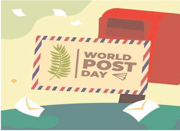
గిద్దలూరు పెన్ పవర్ అక్టోబర్ 9