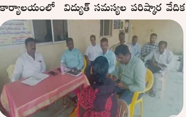
చిత్తూరు, పెన్ పవర్ అక్టోబర్ 09 :

చిత్తూరు నగరంలోని తోటపాళ్ళం లో ఉన్న విద్యుత్ శాఖ కార్యాలయంలో బుధవారం ఉదయం 10.30 నుండి 1 గంట వరకు విద్యుత్ సమస్యల పరిష్కార వేదిక కార్యక్రమాన్ని నిర్వహించారు.