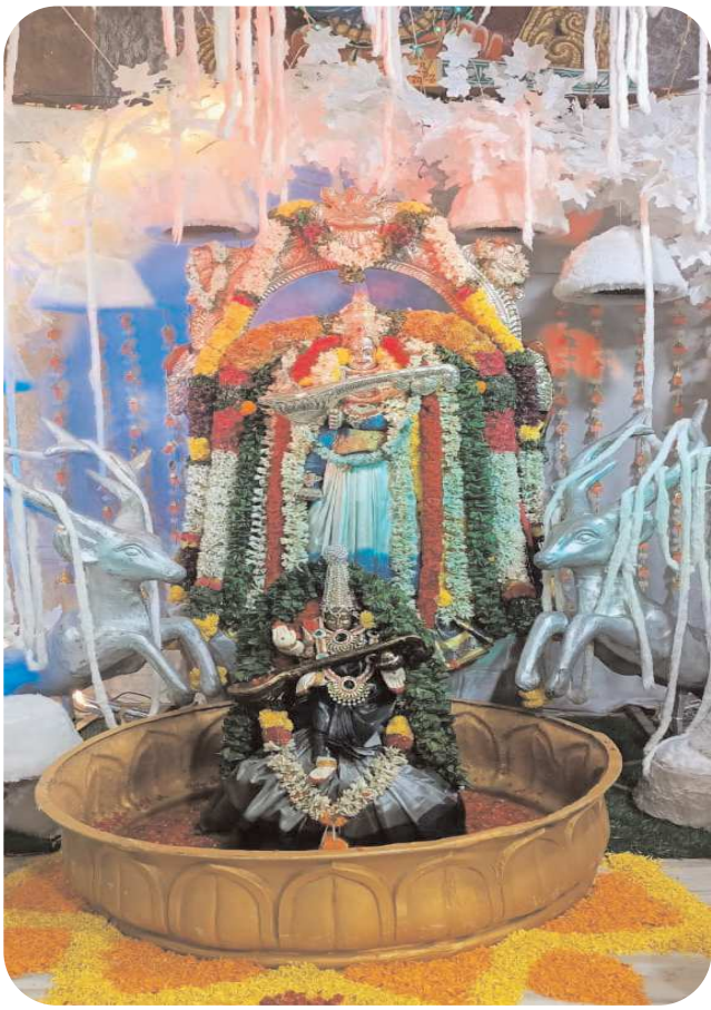
పెన్ పవర్, కంభం పవర్ 9

నవరాత్రి ఉత్సవాలలో సందర్భంగా అమ్మవారు చదువుల తల్లి శ్రీ సరస్వతి దేవి అలంకారంతో దర్శనమిస్తుంది. చైతన్య స్వరూపిణిగా పురాణాలు సరస్వతి దేవిని వర్ణిస్తున్నాయి. బుద్ధిని విద్యను జ్ఞానమును ప్రసాదించి తనను పూర్తి శరణాగతితో ఆరాధించే వారికి యుక్తాయుక్త విదక్షణ జ్ఞానాన్ని వివేచన శక్తిని జ్ఞాపకశక్తిని కల్పన నైపుణ్యాన్ని ప్రసాదించే తల్లి సరస్వతి దేవి . కంభం పట్టణంలోని శ్రీ వాసవి కన్యకా పరమేశ్వరి అమ్మవారు శ్రీ సరస్వతి దేవి అలంకారంతో భక్తులకు దర్శనం ఇచ్చారు. అమ్మవారికి ప్రత్యేక పూజలు నిర్వహించారు. అమ్మవారు ఉత్సవాల సందర్భంగా ప్రతిరోజు ఒక దివ్య అలంకరణతో భక్తులకు దర్శనమిస్తున్నారు. మహిళలు అనేకమంది పూజా కార్యక్రమం నిర్వహించారు. అనంతరం భక్తులకు ఎలాంటి ఇబ్బందులు లేకుండా ఆలయ కమిటీ వారు పలు ఏర్పాట్లు చేశారు. ఆలయం వద్ద పలు సాంస్కృతిక కార్యక్రమాలు ఏర్పాటు చేయడం జరిగింది.