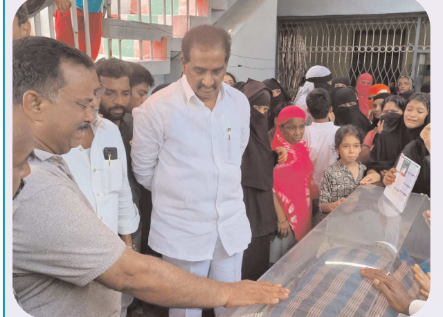
చిలకలూరిపేట పెన్ పవర్ ప్రతినిధి సెషన్లలో 30