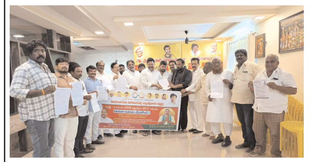
చిలకలూరిపేట పెన్ పవర్ ప్రతినిధి సెషన్లలో 30: