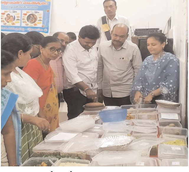
బేస్తవారిపేట మండల ప్రజా పరిషత్ సమావేశం బేస్తవారిపేట మండల ప్రజా పరిషత్ సమావేశం మందిరంలో సోమవారం ఐ సి డి ఎస్ ప్రాజెక్ట్ ఆధ్వర్యంలో పోషణ మహోత్సవ