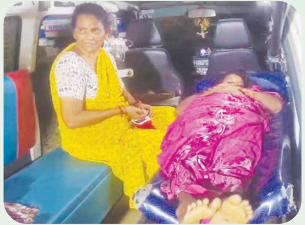
బెన్నవారిపేట, పెన్ పవర్ సెప్టెంబర్ 30: