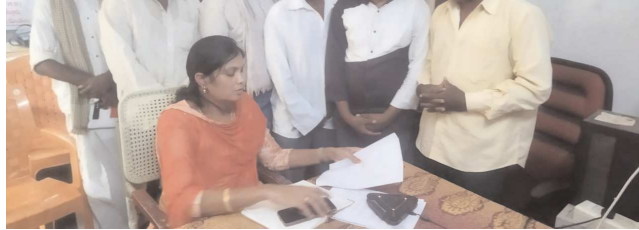
కొమరోలు పెన్ పవర్ సెప్టెంబర్ 30

సోమవారం రాత్రి దీక్షా శిబిరంలోనే జాగరణ చేసిన పారిశుద్ధ కార్మికులు.