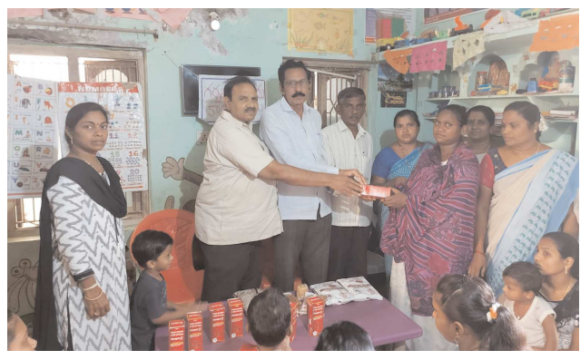
కావలి : పెన్ పవర్ సూన్ సెప్టెంబర్ 30