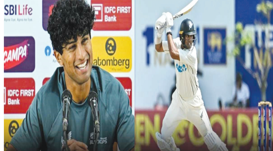
ఈ యువ ఆల్ రౌండర్ తన బ్యాటింగ్ తో తొలి సారి అందరి దృష్టిని ఆకర్షించాడు. ఈ క్రమంలో కివీస్ తరఫున అన్ని ఫార్మాట్లలో చోటు దక్కించుకుని కీలక ప్లేయర్ గా ఎదిగాడు.