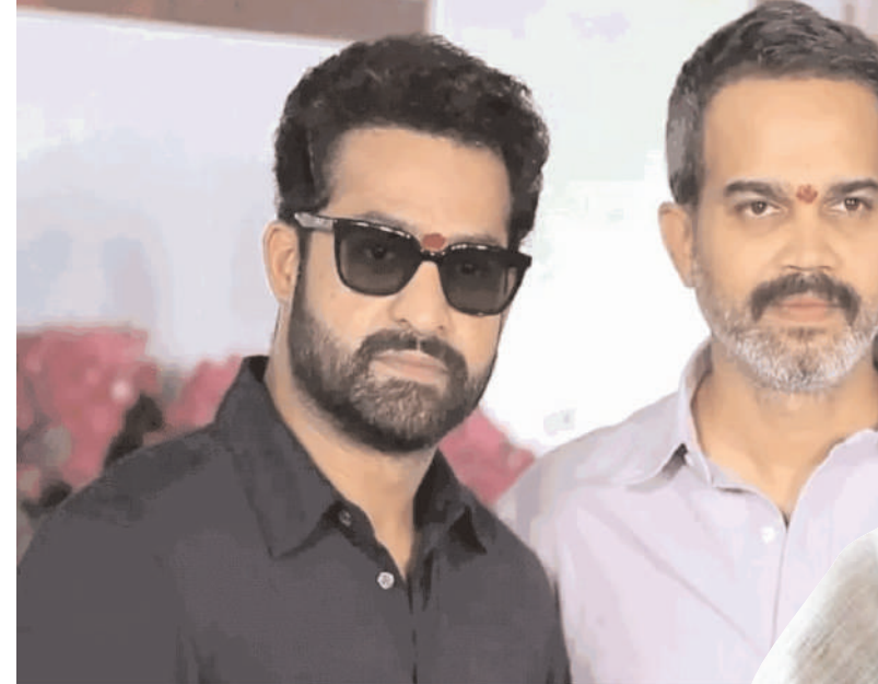
ఓనమ్ ను అందంగా జరుపుకుంటారు అందాలు

హైదరాబాద్ పెన్ పవర్: యంగ్ బ్రిగర్ ఎన్టీఆర్ రాబోయే సినిమాల లైన్ప్ డేనికడే డిఫరెంట్ ఉండబోతున్నట్లు తెలుస్తోంది. కచ్చితంగా అంతకుమించి అనేలా ఉంటాయని ఇప్పటికే అనేక రకాల కథనాలు వైరల్ అయ్యాయి. ఇక 'కేజీఎఫ్' ఫేమ్ ప్రశాంత్ నీల్ కాంబినేషన్ లో రాబోతున్న సినిమా ఇప్పటికే భారీ అంచనాలు రేపుతోంది. అఫీషియల్ గా లాంచ్ అయిన ఈ సినిమా ప్రీప్రొడక్షన్ పనుల్లో ప్రశాంత్ నీల్ బిజీగా ఉన్నారు. ఈ సినిమా ఒక పీరియాడిక్ డ్రామా అని ఒక హిందీ అయితే