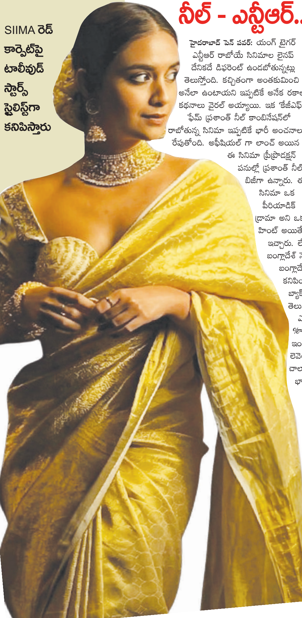
SIIMA రెడ్ కార్పెట్ పై టాలీవుడ్ స్టార్స్ పైలెట్ గా కనిపిస్తారు

మోమినుల్ హక్ కు అద్భుతమైన ఫీల్డ్ సెట్ ను విధించాడు. మోమినుల్ పదే పదే స్వీప్ పోజ్ కు ప్రయత్నిస్తుంటే రోహిత్ తన వ్యూహాలను మార్చాడు. అశ్విన బౌలింగ్ లో చుట్టూ ఫీల్డర్లను ఉంచాడు. అటాకింగ్ ఫీల్డ్ సెట్ తో ఒత్తిడిలో పడేశాడు. స్లిప్, షార్ట్ కవర్, షార్ట్ లెగ్, లెగ్ స్లిప్ లో ఫీల్డర్లను ఉంచాడు. దీంతో మోమినుల్ హక్ తీవ్ర ఒత్తిడిలో లెగ్ స్లిప్ లో రాహుల్ కు క్యాచ్ ఇచ్చి జెట్టుకొట్టాడు. సాధారణంగా లెగ్ స్లిప్ లో ఫీల్డర్ ను ఉంచడం అరుదు. కానీ రోహిత్ నిర్ణయం ఫలించింది. అంతేకాదు బౌలింగ్ కు జడజాను సరైన సమయంలో తీసుకొచ్చాడు. అతను బద్ రోజు తన తొలి ఓవర్లోనే రెండో బంతికి శాంతోను జెట్ చేశాడు. దీంతో రోహిత్ పై సర్వత్రా ప్రశంసల వర్షం కురుస్తుంది. దిగ్గజ బ్యాటర్ సునీల్ గవాస్కర్ రోహిత్ కెప్టెన్సీని కొనియాడాడు. ఈ మ్యాచ్ విషయానికి వస్తే చివరి రోజు బంగ్లాదేశ్ విధించిన 95 పరుగుల స్వల్ప లక్ష్యాన్ని భారత్ 3 వికెట్ల కోల్పోయి 14 ఓవర్లలో ఛేజ్ చేసింది. ఓపెనర్ యశస్వి జైస్వాల్ (40), కోహ్లీ (24) జాగ్రత్తగా ఆడి భారత్ కు విజయాన్ని అందించారు. రోహిత్ (8), గిల్ (6) విఫలమయ్యారు. దీంతో భారత్ సిరీస్ ను 2-0 తేడాతో గెలుచుకుంది. తొలి మూడు రోజుల తర్వాత ద్రా ఖాయమన్న దశలో చివరి రెండు రోజులు రోహిత్ సేన అసాధారణంగా పోరాడి గెలిచింది.