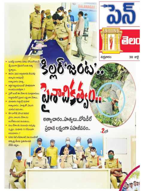
2021 నాటి నిందితుల అరెస్ట్ రిమాండ్ ప్రెస్ మీట్ పై "పెన్ పవర్" దినపత్రిక వార్తా కథనం