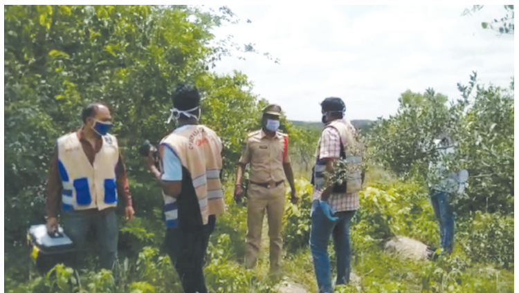
2021 జూలైలో భామిని మృతదేహం వద్ద పోలీసులు.. ఫైల్ ఫోటో..

- 2 పేజీ తరువాయి అత్యాచారం.. హత్యలు.. దోపిడీలే లక్ష్యంగా.. సహజీవనం కొనసాగిస్తూ, పలు నేరాలకు పాల్పడిన కిల్లర్ జంటకు