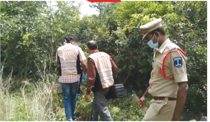
2021 జూలై నెలలో అంకిరాల గుట్టలో మృతదేహం వద్దకు పోలీసులు.. ఫైల్..