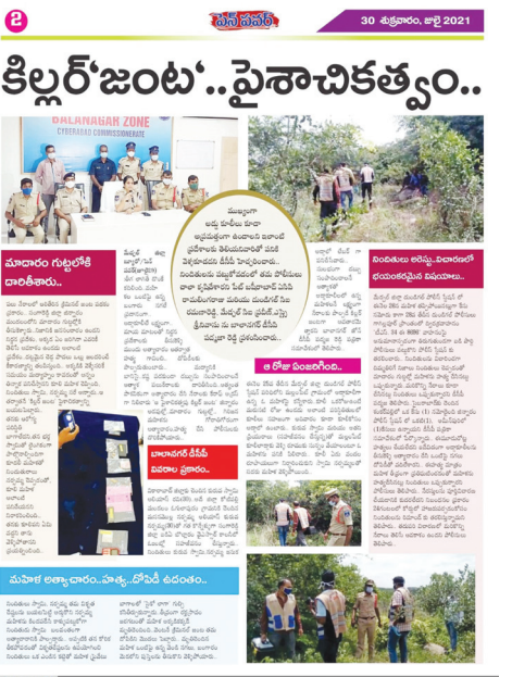
పెన్ పవర్ 30-07-2021 TELANGANA MAIN & TAB - 30 Jul 2021 - Page 1

- 2 పేజీ తరువాయి అత్యాచారం.. హత్యలు.. దోపిడీలే లక్ష్యంగా.. సహజీవనం కొనసాగిస్తూ, పలు నేరాలకు పాల్పడిన కిల్లర్ జంటకు