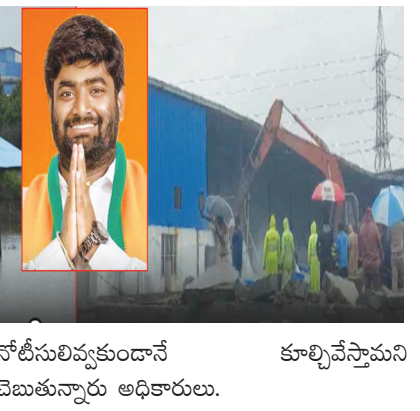
నోటీసులివ్వకుండానే కూల్చివేస్తామని చెబుతున్నారు అధికారులు.

ఆరోపణలు వచ్చాయి. దీని విలువ రూ. 75 కోట్లు ఉంటుందని చెప్పారు అధికారులు. దీంతో 13 భారీ కట్టడాలను నేలమట్టం చేశారు హైద్రా అధికారులు. ఇప్పటికే హైద్రా అధికారులు బాచుపల్లి, నిజాంపేట, శేర్లింగంపల్లి, మియాపూర్ లో ఎఫ్ టీఎల్, బిఫర్ జోన్ లో నిర్మించిన అక్రమ నిర్మాణాలను కూల్చేశారు అధికారులు.