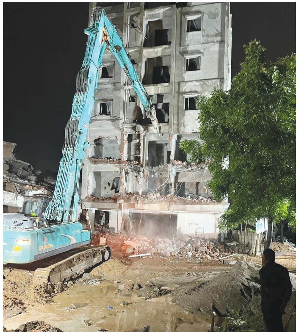
బాచుపల్లి ఎర్రకుంట చెరువులో హైద్రా కూల్చివేతల నాటి ఫోటో..