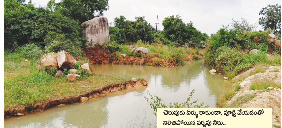
చెరువుకు నీళ్ళు రాకుండా, పూడ్చి వేయడంతో నిలిచిపోయిన వర్షపు నీరు..