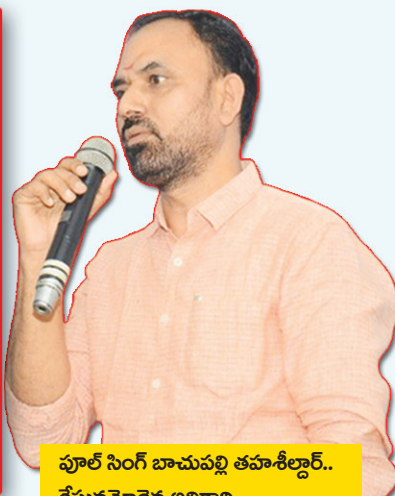
ఫూల్ సింగ్ బాచుపల్లి తహశీల్దార్.. కేసునమోదైన అధికారి..