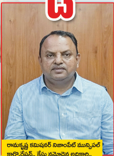
రామకృష్ణ కమిషనర్ నిజాంపేట్ మున్సిపల్ కార్పొరేషన్.. కేసు నమోదైన అధికారి..

మేడ్చల్ జిల్లా బ్యూరో, పెన్ పవర్, ఆగస్టు 31: