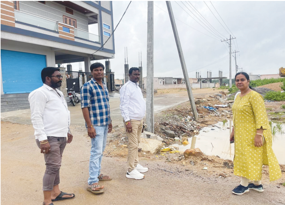
పూడ్చేసిన కట్టకాలుపై నిర్మాణాలను పరిశీలిస్తున్న ఇరిగేషన్ ఏఈ సారా, మత్స్యకారులు..

ఎనబై నాలుగు కుటుంబాల మత్స్యకారుల జీవనోపాధికి ముప్పు..