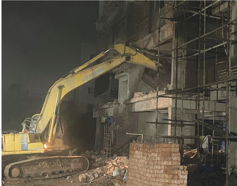
ఎర్రకుంట చెరువులో అర్ధరాత్రి కూల్చివేతల ఫోటో.. ఆగస్టు 15..