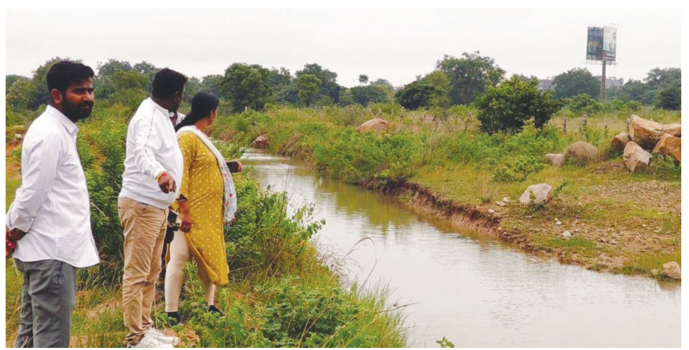
కట్టకాలువను పరిశీలిస్తున్న అధికారి, మత్స్యకారులు..