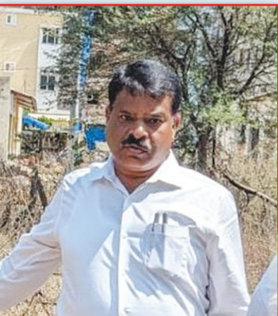
శ్రీనివాసులు.. మేడ్చల్ జిల్లా ఏడి సర్వేయర్..