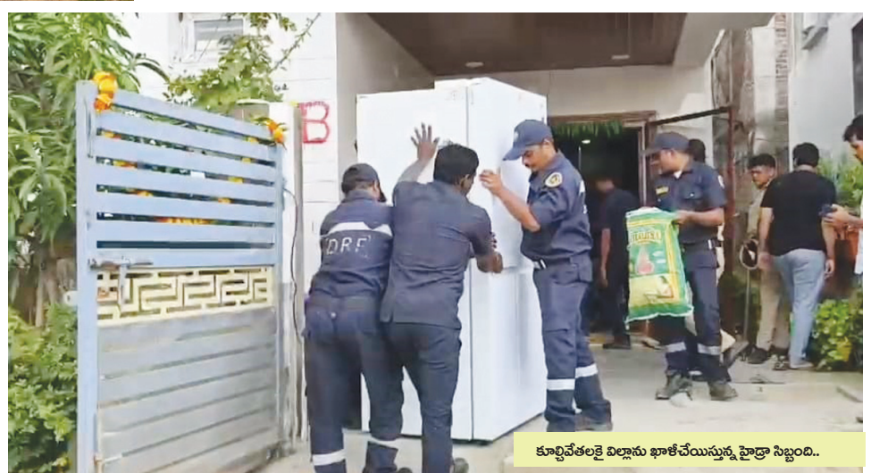
కూల్చివేతలకి విల్లాను ఖాళీచేయిస్తున్న హైద్రా సిబ్బంది..