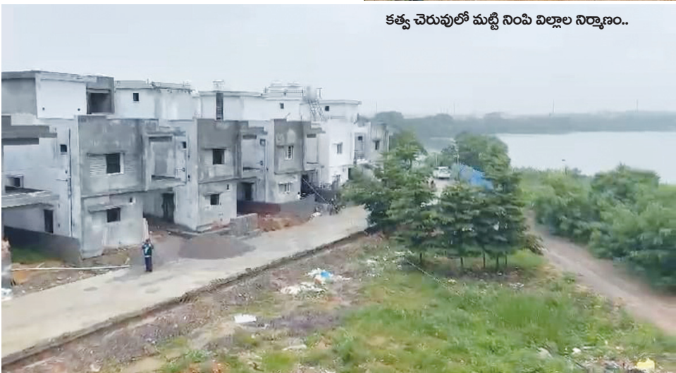
కత్వ చెరువులో మట్టి నింపి విల్లాల నిర్మాణం..

వరకు 15 విల్లాలు కూల్చి వేసినట్లు అధికారులు తెలిపారు.. మిగతా విల్లాలకు రెండు వారాలు గడువు ఇస్తూ ఖాళీ చేయాల్సిందిగా విల్లా వాసులను అధికారులు ఆదేశించారు..