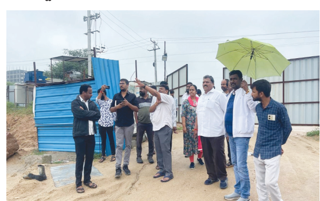
బాచుపల్లి వాసవి కన్స్ట్రక్షన్లో హైద్రా, ఇరిగేషన్ అధికారుల పరిశీలన..