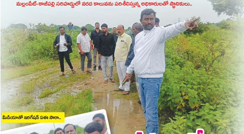
మీడియాతో ఇరిగేషన్ ఏకా సారా..

మల్లంపేట్-కాజీపల్లి సరిహద్దులో వరద కాలువను పరిశీలిస్తున్న అధికారులతో స్టానికులు..