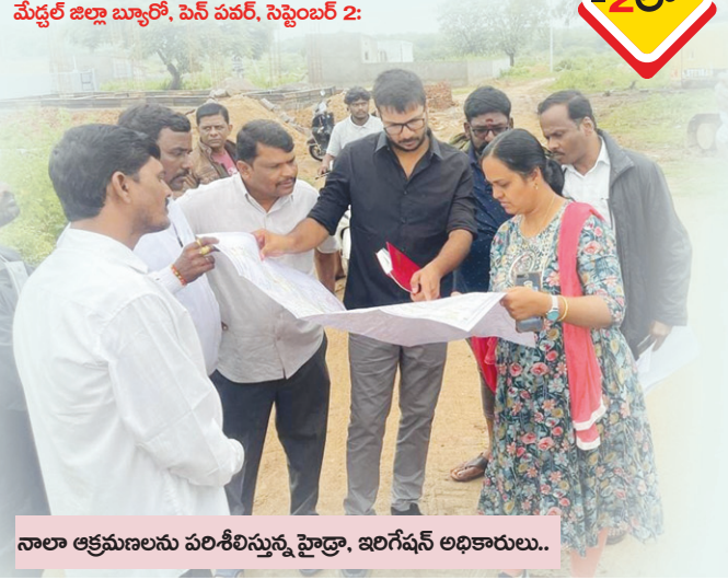
నాలా ఆక్రమణలను పరిశీలిస్తున్న హైద్రా, ఇరిగేషన్ అధికారులు..

రెండు జిల్లాల సరిహద్దులో ఉన్న ప్రభుత్వ భూములు, చెరువు కట్టుకాలువల ఆక్రమణపై రెండు వైపులా రెవెన్యూ అధికారుల నిర్ణయం ఉందని స్పష్టమవుతుంది.. మల్లంపేట్ మత్స్యకారుల ఫిర్యాదులతో గత రెండు రోజులుగా "పెన్ పవర్" దినపత్రికలో వస్తున్న వార్తా కథనాలతో "హైద్రా" ఇరిగేషన్ అధికారుల పరిశీలనలో తేటతెల్లం అయింది.. భారీ వర్షాలతో కబ్బాల గుట్టు రట్టు అయింది.. కాజీపల్లి రెవెన్యూ అధికారుల నిర్వాహకం బట్టబయలు అయింది.. కాజీపల్లి రెవెన్యూ పరిధిలోని సర్వే నెం.181 ప్రభుత్వ భూమి మొత్తం 1540 ఎకరాలు.. అందులో 10 ఎకరాలు ఇందిరమ్మ ఇండ్ల పట్టణంలకు ఉన్నది ఆంధ్రప్రదేశ్ ప్రభుత్వంలోనే కేటాయించారు.. దీనిని అడ్డు పెట్టుకుని..!కాజీపల్లి సర్వే నెం.181 ప్రభుత్వ స్థలం మూడింతలు కబ్బాకు గురవుతుంటే "తిలాపాపం తలాపిడికెడు" అన్న చందంగా రెవెన్యూ నిష్పాకునీరెత్తినట్లు వ్యవసాయ-చారని సోమవారం అధికారుల పరిశీలనలో తేటతెల్లం అయింది.. ఇంత జరుగుతున్నా దుండిగల్ రెవెన్యూ అధికారులు హైద్రా, ఇరిగేషన్ అధికారుల పర్యటనలో పాల్గొనక పోవడం పలు అనుమానాలను రేకెత్తిస్తుంది.. మల్లంపేట్-కాజీపల్లి సరిహద్దులో వరదకాలువల కబ్బాలో కాజీపల్లికి చెందిన పలువురు ప్రముఖ విలేజ్మెంట్ల బహుళ అంతస్తుల ఇండ్లు ఉన్నట్లు సమాచారం..?