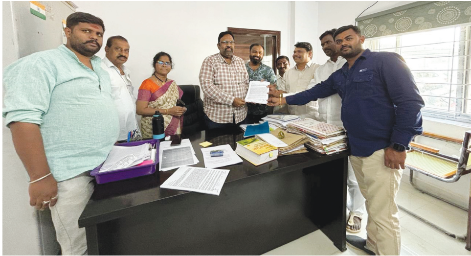
కుత్బుల్లాపూర్ డిప్యూటీ తహశీల్దార్ కి బీజేపి వినతిపత్రం..