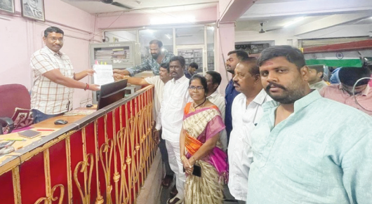
కుత్బుల్లాపూర్ ఎస్ఆర్ఓకి వినతిపత్రం అందజేస్తున్న బీజేపీ నేతలు..