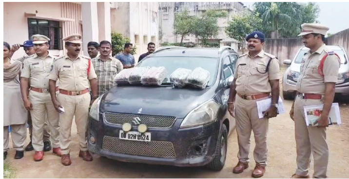
గంజాయితో పట్టుబడిన రెండు వాహనాలు..