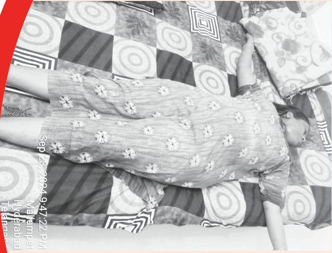
హత్యకు గురైన బొద్దుల శారద..

దోపిడీ దొంగల పనిగా భావిస్తున్న పోలీసులు..