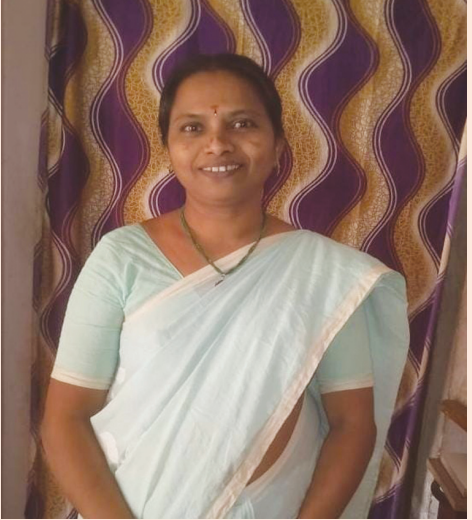
మృతురాలు శారద.. ఫైల్ ఫోటో..