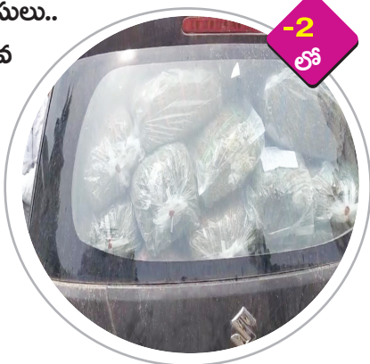
కారులో గంజాయి బెండల్స్..