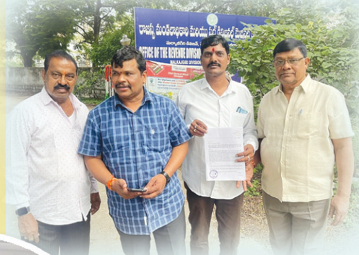
డబుల్ ఇళ్ళ కేటాయింపులో స్థానిక కోటాకై బీజేపీ నేతలు ఆర్డీవోకి వినతిపత్రం..