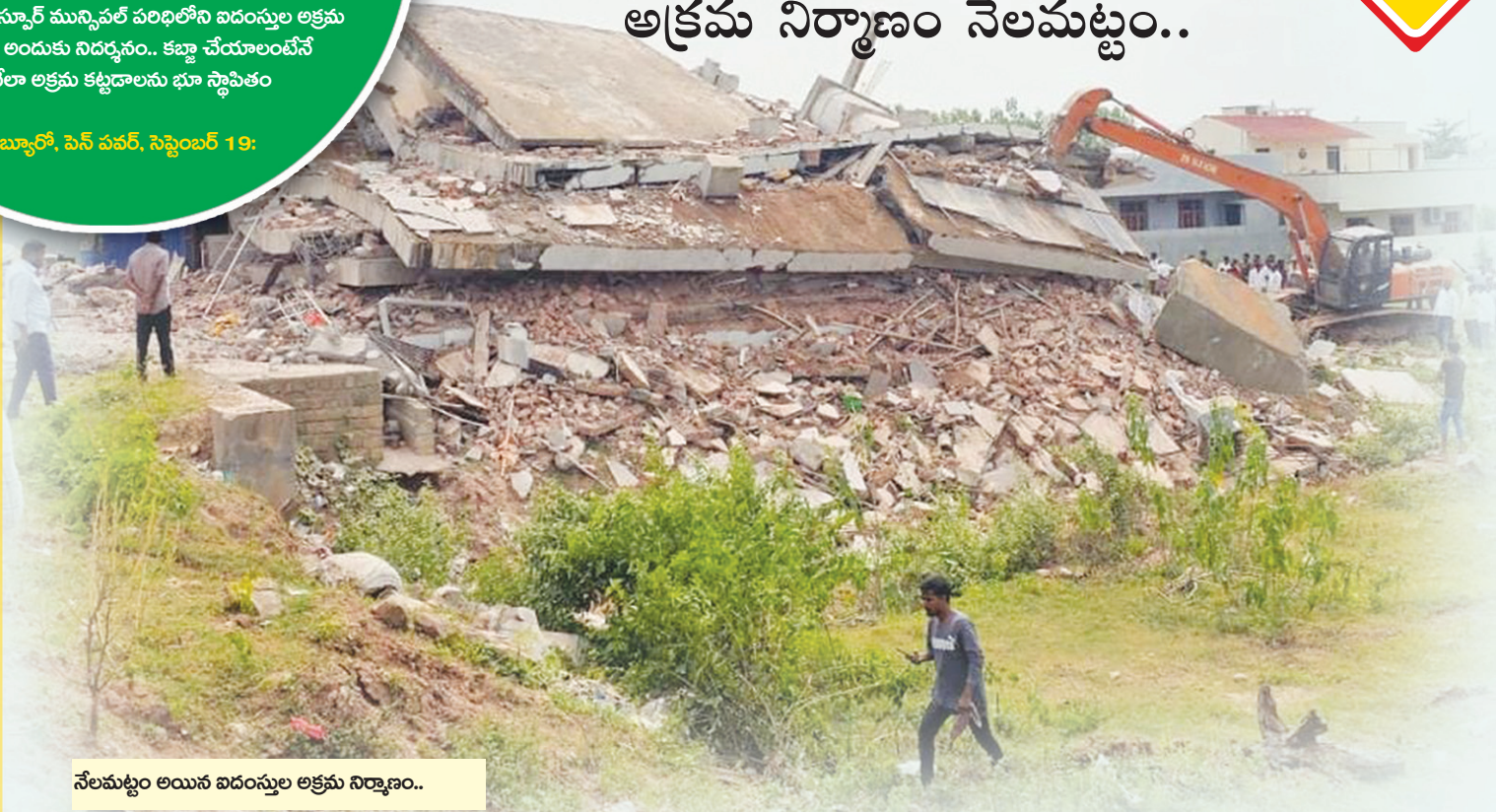
నేలమట్టం అయిన ఐదంస్తుల అక్రమ నిర్మాణం..

తెలంగాణ రాష్ట్ర వ్యాప్తంగా వివిధ జిల్లాల్లో ఇప్పుడు ‘హైద్రా’ స్ఫూర్తిలో, అదే తరహాలో అధికారులు చర్యలకు దిగుతున్నారు.. ఎక్కడో ఓచోట కొద్దిపాటి వ్యతిరేకత ఉన్నప్పటికీ..! అది కేవలం కబ్జాదారులందే కనుక, ప్రభుత్వం కూడా పెద్దగా పట్టించుకోవడం లేదు.. రాజధాని శివార్ల వరకే హైద్రా పరిమితమైనప్పటికీ.. పలు జిల్లాలకు హైద్రాను విస్తరించాలని ప్రజ కోరుకుంటున్నారు.. మరోవైపు ముఖ్యమంత్రి రేవంత్ రెడ్డి కొద్దిరోజుల క్రితం జిల్లాలోను చెరువులు, ప్రభుత్వ భూములు కబ్జాలకు పాల్పడితే హైద్రా స్ఫూర్తిలో చర్యలు చేపట్టాలనే ఆదేశాలు.. ఇప్పుడు ఒక్కొక్కటిగా అమలు చేస్తున్నట్లు స్పష్టమవుతుంది.. గురువారం మంచుర్యాల జిల్లా నస్సూర్ మున్సిపల్ పరిధిలోని ఐదంస్తుల అక్రమ నిర్మాణం కూల్చవేత అందుకు నిదర్శనం.. కబ్జా చేయాలంటేనే వణుకు పుట్టించేలా అక్రమ కట్టడాలను భూ స్థాపితం చేస్తున్నారు.. స్టేట్ బ్యూరో, పెన్ పవర్, సెప్టెంబర్ 19: