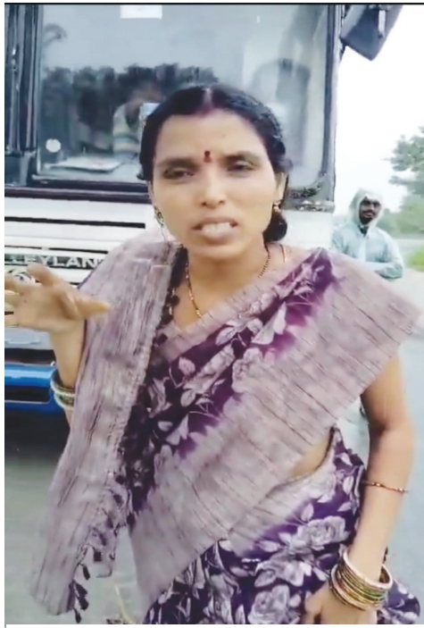
వాగులో చిక్కుకుపోయిన బస్సు..