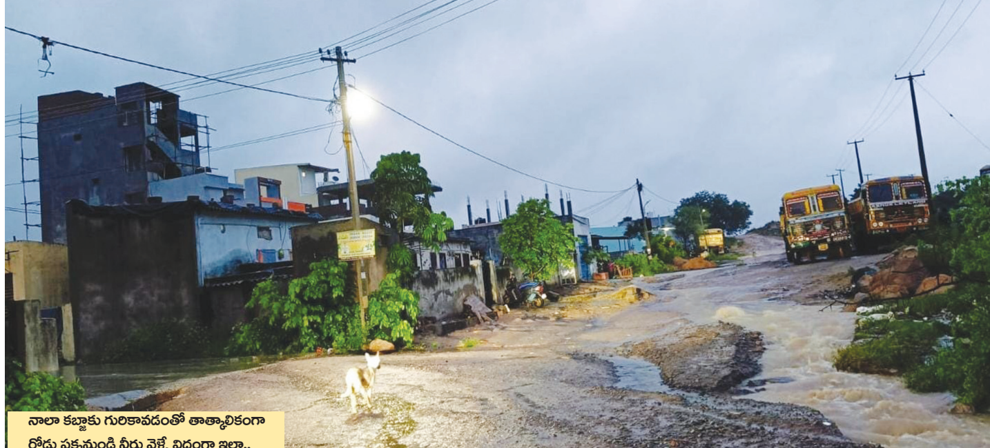
నాలా కబ్జాకు గురికావడంతో తాత్కాలికంగా రోడ్డు పక్కనుండి నీరు వెళ్ళే విధంగా ఇలా..