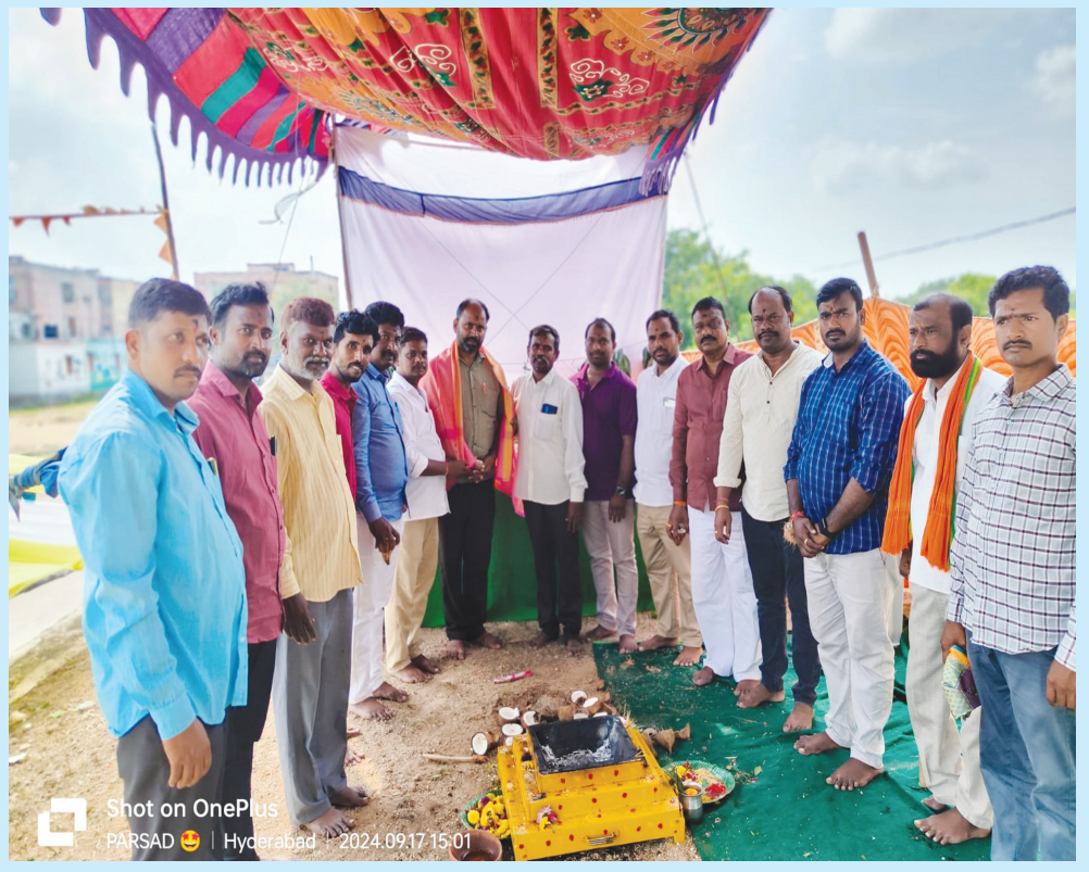
Hyderabad | 2024.09.17 15:01