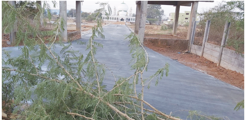
అధికారులు కందకం తవ్వినా.. యధేచ్ఛగా సీసీరోడ్డు..2021-22 జనవరి..

పంచాయతీరాజ్ శాఖ అధికారులు, సర్వే నెం.227 ప్రభుత్వ భూమిని చూపించకుండానే, సర్కారు నిధులు రూ.60 వ్యయంతో సీసీరోడ్డు నిర్మించడానికి, జిల్లా ఉన్నతాధికారి అమోదం తెలిపారా.. తెలిసే సంతకం పెట్టారో జరుగుతున్న సీసీరోడ్డు నిర్మాణంతో తేటతెల్లం అవుతుంది.. ఓవైపు హైకోర్టు కేసులో ఉంది, మరోవైపు ప్రభుత్వ భూమిలో ఎలాంటి కబ్జా కార్యకలాపాలు