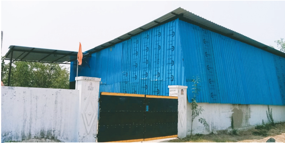
227లో దుండిగల్ తహశీల్దార్ ఇచ్చిన నోటీసు ఈ అక్రమ షెడ్యూల్.. చర్యలు నిల్..