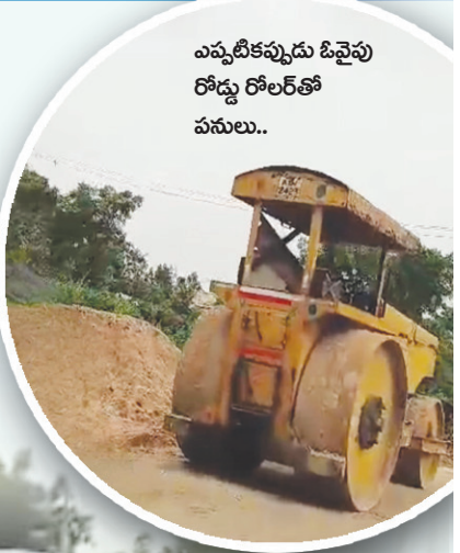
ఎప్పటికప్పుడు ఓవైపు రోడ్డు రోలర్తో పనులు..