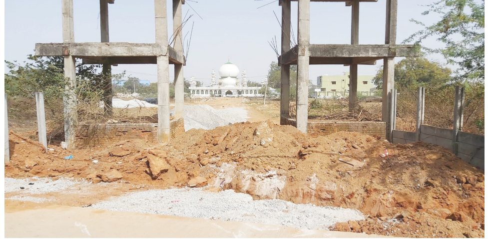
సర్వే నెం.120/24లో నిర్ణయ ప్రదేశంలో సీసీరోడ్డు పనులు 2021-22 జనవరి నాటి.. ఫైల్ ఫోటో..