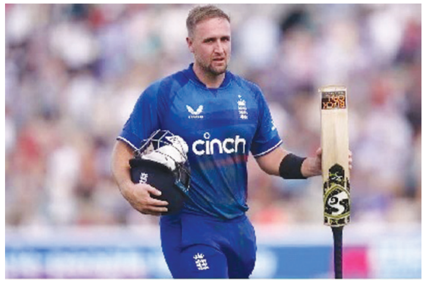
మైదానంలో ఆస్ట్రేలియాపై ఇంగ్లండ్ కు ఇదే అత్యధిక (312) స్కోరు. ఒక ఓవర్ లో అత్యధిక పరుగులు సమర్పించుకున్న చెత్త రికార్డును స్టార్ట్ మూటగట్టుకున్నాడు.

లార్డ్స్ మైదానంలో ఆస్ట్రేలియాకు ఘోర పరాభవం 25 బంతుల్లోనే అర్ధ సెంచరీ చేసిన లివింగ్ స్టోన్ 126 పరుగులకే ఆలౌట్ అయిన ఆస్ట్రేలియా