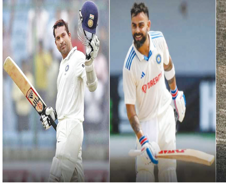
హైదరాబాద్ పెన్ పవర్: టీమిండియా స్టార్ బ్యాటర్ విరాట్ కోహ్లా బంగ్లాదేశ్ తో జరగబోయే రెండో టెస్ట్ మ్యాచ్ లో రెండు రికార్డ్స్ పై కన్నేసాడు. వీటిలో ఒకటి మాస్టర్ బ్లాస్టర్ సచిన్ కాన్సూర్ వేదికగా రెండో టెస్ట్ ప్రారంభమవుతుంది.

బెంగాల్ రికార్డ్ కాగా.. మరొకటి ఆల్ టైం గ్రేట్ బ్యాటర్ బ్రాడ్ మాన్ డి. ఇప్పటివరకు కోహ్లా తన అంతర్జాతీయ క్రికెట్ లో 26965 పరుగులు చేశాడు. మరో 35 పరుగులు చేస్తే అంతర్జాతీయ క్రికెట్ లో వేగంగా 27000 పరుగులు పూర్తి చేసుకుంటాడు. ఇప్పటివరకు ఈ రికార్డ్ సచిన్ పై ఉండగా.. కోహ్లా ఈ రికార్డ్ బ్రేక్ చేయడం ఖాయంగా కనిపిస్తుంది. సచిన్ బెంగాల్ రికార్డ్ సంగకర్త. రిశీ పాండింగ్ మాత్రమే ఇప్పటివరకు అంతర్జాతీయ క్రికెట్ లో 27000 పరుగులు చేశారు. ఫీల్డర్ గాను టెస్ట్ క్రికెట్ లో మరో మూడు క్యాచ్ లు తీసుకుంటే సచిన్ ను అధిగమిస్తాడు. అదే జరిగితే టెస్ట్ క్రికెట్ లో భారత్ తరపున అత్యధిక క్యాచ్ లు అందుకున్న మూడో ఫీల్డర్ గా నిలుస్తాడు. ఈ ఫాన్సాబిల్ రికార్డ్ బ్రేక్ భారత్ తరపున అత్యధిక క్యాచ్ లు (210) అందుకున్నాడు. వీవీఎస్ లక్ష్మణ్ 135 క్యాచ్ లతో రెండవ స్థానంలో ఉన్నాడు. టెస్ట్ క్రికెట్ లో ఇప్పటివరకు 29 సెంచురీలు చేసిన కోహ్లా.. మరో సెంచురీ చేస్తే బ్రాడ్ మాన్ సెంచురీల రికార్డ్ అధిగమిస్తాడు. బ్రాడ్ మాన్, కోహ్లా సంయుక్తంగా 29 సెంచురీలు సెంచురీలు చేశారు. ప్రస్తుతం టెస్ట్ క్రికెట్ లో కోహ్లా పెద్దగా ఫామ్ లో కనిపించడం లేదు. గత రెండేళ్లలో అతని యావరేజ్ బాగా తగ్గిపోయింది. ఇటీవలే బంగ్లాతో ముగిసిన తొలి టెస్టులో తొలి ఇన్నింగ్స్ లో 6.. రెండో ఇన్నింగ్స్ లో 17 పరుగులు మాత్రమే చేసి విఫలమయ్యాడు. సెప్టెంబర్ 27 నుంచి