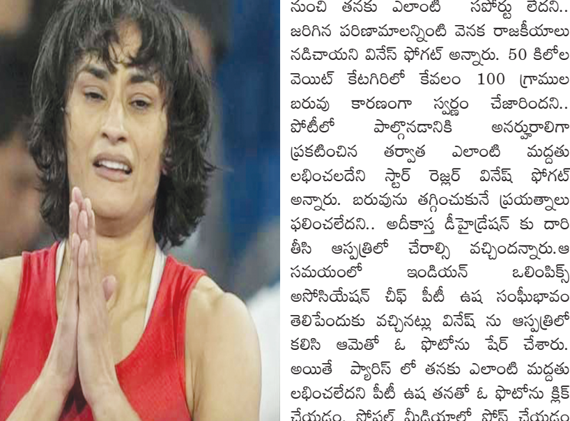
పారిస్ ఒలింపిక్స్ నుంచి అనర్హత, ఆ తర్వాత జరిగిన పరిణామాలపై స్టార్ రెజ్లర్ వినేష్ ఫోగట్ ఆసక్తికర వ్యాఖ్యలు చేశారు. ఒలింపిక్స్ అనర్హత తర్వాత ఇండియన్ ఒలింపిక్స్ అసోసియేషన్