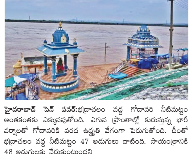
హైదరాబాద్ పేన్ పవర్: భద్రాచలం వద్ద గోదావరి నీటిమట్టం అంతంతకు ఎక్కువవుతోంది. ఎగువ ప్రాంతాల్లో కురుస్తున్న భారీ వర్షాలతో గోదావరికి వరద ఉధృతి వేగంగా పెరుగుతోంది. దీంతో భద్రాచలం వద్ద నీటిమట్టం 47 అడుగులు దాటింది. సాయంత్రానికి 48 అడుగులకు చేరుకుంటుందని

భద్రాచలం వద్ద 47 అడుగులు దాటిన గోదావరి నీటిమట్టం • 48 అడుగులకు చేరుకోగానే రెండో ప్రమాద హెచ్చరికను జారీ చేయనున్న అధికారులు • నిన్న ఉదయం ఏడున్నరకు 43 అడుగులకు చేరిన గోదావరి నీటిమట్టం • నిన్న ఉదయం మొదటి ప్రమాద హెచ్చరికను జారీ చేసిన అధికారులు వివరాలు 2లో..